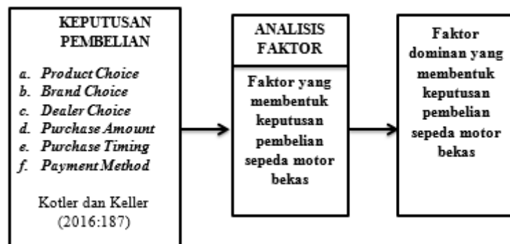
Gambar II. Kerangka Pemikiran Sumber: Kotler dan Keller (2016:187)