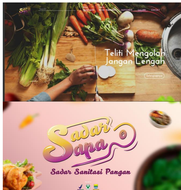
Gambar 6. Website

Untuk menunjang proses edukasi, penulis membuat sebuah website. Website berfungsi untuk memberikan informasi lebih lanjut mengenai kampanye terkait, informasi kesehatan, forum, resep makanan, dan event terdekat yang akan dilakukan.