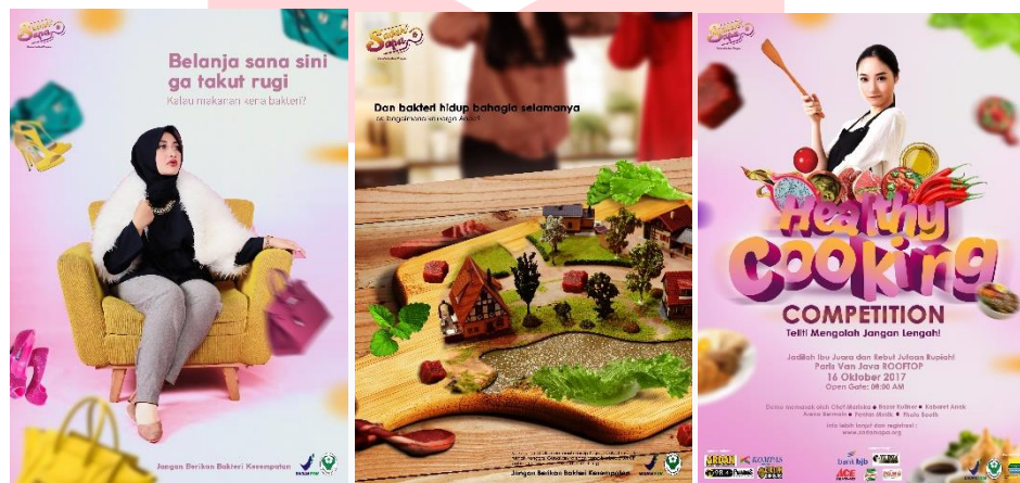
Gambar 3. Rangkaian Poster Kampanye

Tahap berikutnya penulis mengeluarkan sebuah poster. Pada poster tersebut penulis menggunakan majas metofora, dimana maksud dan tujuannya membandingkan sesuatu berdasarkan sifat yang hampir sama. Majas ini digunakan agar khalayak sasaran mengerti bahwa jika kontaminasi silang terjadi, bakteri dapat hidup di alat dapur. Selain itu, poster tersebut memiliki pesan yang bertujuan untuk mengingatkan Ibu rumah tangga agar lebih aware terhadap alat dapur.