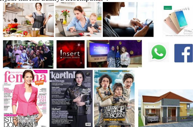
Gambar 1. Moodboard khalayak sasaran

Berdasarkan hasil analisa yang penulis peroleh, maka pesan yang disesuaikan dengan khalayak sasaran adalah pesan yang informatif dan mengandung sisi emosional. Adapun pesan yang didapatkan adalah “keracunan terjadi karena adanya kesempatan”.