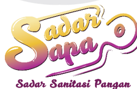
Gambar 1. Logo Kampanye

Dalam merancang strategi kampanye kesehatan ini maka perancangan awal dimulai dengan membuat nama kampanye dan logo. Logo penulis menggunakan elemen handwriting agar terlihat lebih dinamis. Logo handwriting juga mempermudah khalayak untuk mengingat identitas kampanye tersebut, karena pada logo tersebut juga tertera nama dari kampanye itu sendiri. Logo kampanye sebagai berikut: