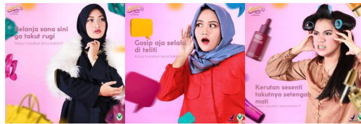
Gambar 2. Konten viral

diharapkan dapat mempengaruhi netizen untuk membuat konten tersebut menjadi viral dengan cara mereka mengikuti gaya dari konten sosial media yang nantinya akan disebar luaskan.