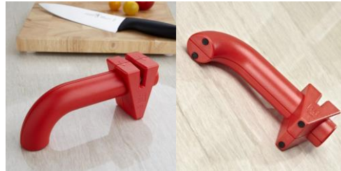
Gambar 5. Ambient Media

Disamping sebuah event, penulis membuat sebuah rancangan ambient media. Ambient media ini berfungsi untuk memberikan pengalaman dan edukasi secara langsung kepada target audience. Sehingga target audience dapat terhubung dengan proses kampanye ini. Ambient media ini berperan sebagai solusi praktis dari permasalahan yang melatar belakangi kampanye ini. media ini berupa sebuah alat yang dapat berfungsi sebagai sanitizer alat dapur khususnya pisau. Cara penggunaan alat ini sangat sederhana dengan cara menggesekkan pisau ke celah yang terdapat di alat tersebut. Celah tersebut dapat diisi dengan air air, sabun, bahkan sanitizer untuk membersihkan pisau. Ambient ini akan tersedia di event dan dijadikan sebagai merchandise untuk tamu VIP.