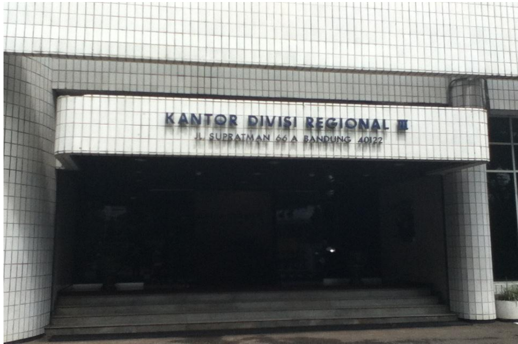
Gambar 1.3. PT. Telkom regional III Jl. WR. Supratman