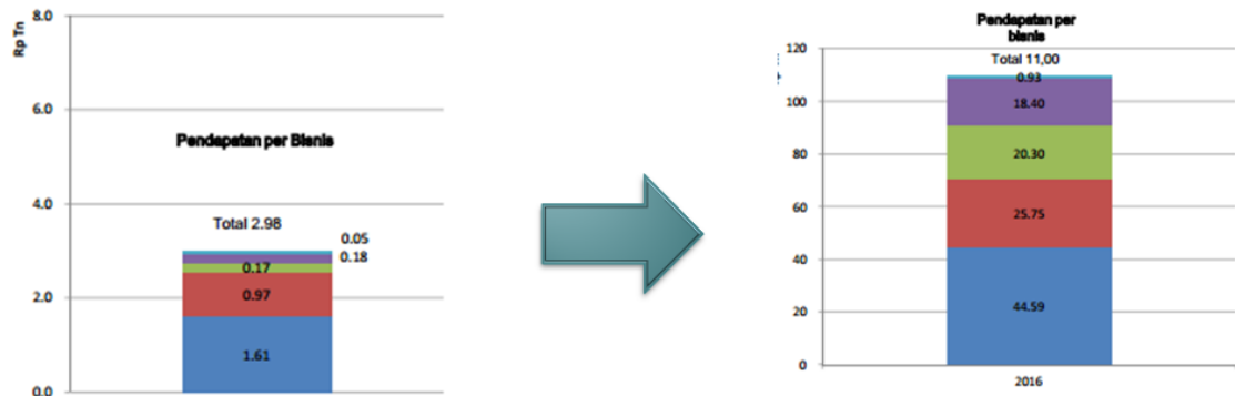
Gambar I-3 Revitalisasi PT. Pos Indonesia tahun 2012-2016 (RJP PT. Pos Indonesia)

System ) mendukung proses bisnis pada tiga layanan utama (jasa keuangan, logistik serta surat dan paket) secara langsung.