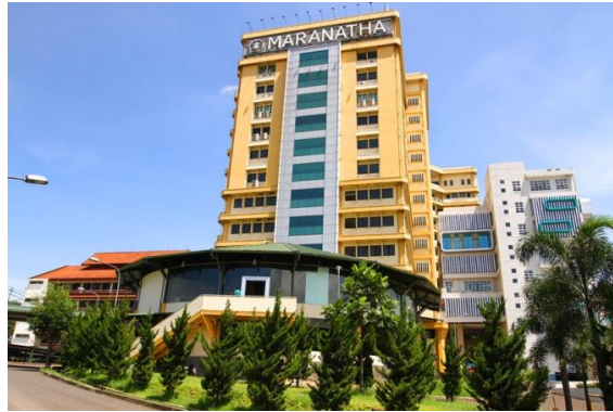
Gambar 1.1 Gedung Graha Widya Maranatha

Fasilitas yang ada pada PTUKM yang akan menjadi area redesain yaitu :