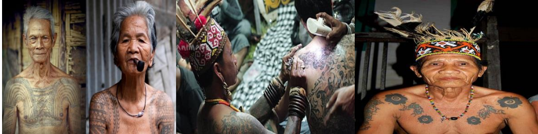
Gambar 1.2 Tato Suku Dayak

sama lain tapi tujuan pembuatan tato sendiri sebenarnya sama tentang religi yang berfungsi sebagai obor atau penerangan dalam perjalanan menuju keabadian setelah kematian. Menurut suku dayak semakin banyak tato yang terdapat di tubuh seseorang maka semakin terang jalan menuju alam keabadian.