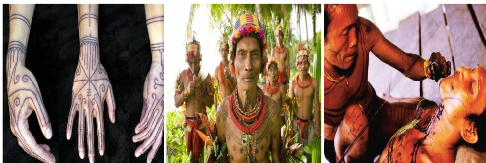
Gambar 1.1 Tato Suku Mentawai

Bagi suku Mentawai tato memiliki beberapa fungsi, menurut artikel dalam kababaik.com yang berjudul “Tato sebagai simbol budaya Mentawai” fungsi pertama yaitu jati diri, status sosial ataupun profesi contohnya seorang pemburu memiliki tato bergambar hewan buruannya seperti rusa, kera, babi atau buaya berbeda dengan tato yang dimiliki oleh seorang dukun tatonya bergambar binatang sibalubalu, berbeda pula dengan petarung dan sebagainya. Fungsi kedua ialah sebagai simbol keseimbangan alam, suku mentawai sangat menghormati alam karena hidup mereka berdampingan dengan alam sehingga digambarkan dengan tato bergambar pohon, batu, hewan, matahari, dan sebagainya. Fungsi ketiga keindahan masyarakat mentawai dikenal juga memiliki citra seni yang tinggi.