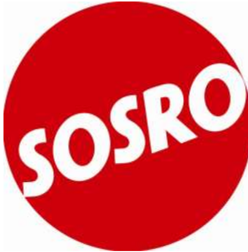
Gambar 1. 2 Logo Perusahaan Sosro