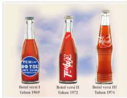
Gambar 1. 1 Logo Teh botol Sosro

botol kemasan telah mengalami tiga kali perubahan. Versi kemasan ditampilkan pada gambar sebagai berikut :