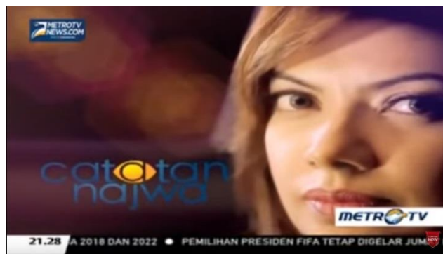
Gambar 1.1 Catatan Najwa