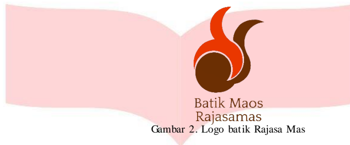
Gambar 2. Logo batik Rajasa Mas