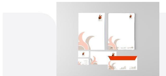
Gambar 3. Stationery