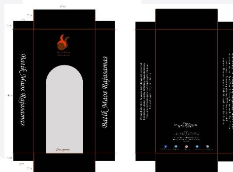
Gambar 8. Pacaging