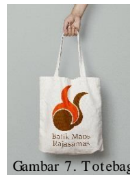
Gambar 7. Totebag