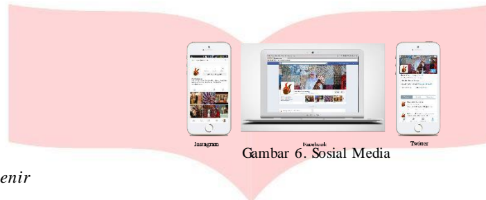
Gambar 6. Sosial Media