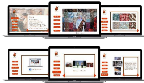
Gambar 5. Website