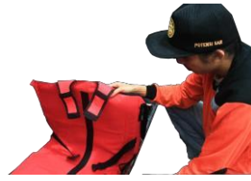
Pada bagian sisi alas di rapatkan satu satu