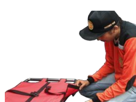
Bagian ujung alas di rapatkan pada lipatan ujungnya