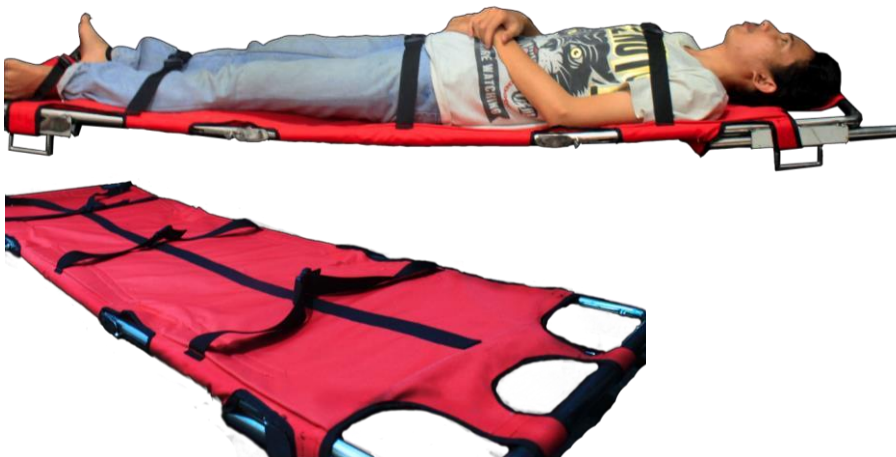
Gambar 5 Foto Produk

Tandu ini merupakan tandu yang dikhususkan untuk medan hutan gunung