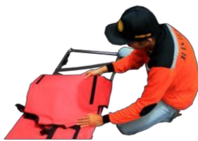
Alas tandu dibentangkan

Alas tandu Berfungsi untuk memberikan kenyamanan pada korban pada saat dibawa ke posko, sehingga korban tidak banyak bergerak pada saat evakuasi berlangsung.