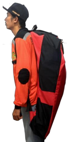
Gambar 5 Tas tandu

Tas tandu berfungsi untuk membawa tandu supaya tandu tidak mudah rusak pada saat di bawa ke medan yang vegetasinya lebat dan lebih aman ketika tandu di tumpuk dengan barang –barang lain