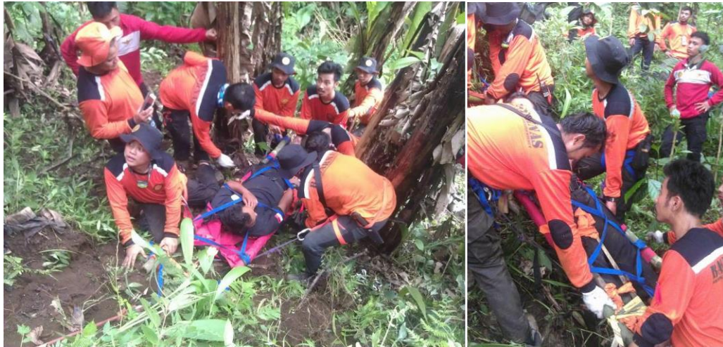
Gambar 3 Evakuasi Korban

Evakuasi korban dilakukan dengan tehnik yang sudah di latih dalam berbagai medan baik vertical ataupun horizontal, karena bagi korban yang selamat keamanan menjadi prioritas yang utama. Medan pada hutan gunung mempengaruhi kerja alat yang dipakai, nyaman pada saat di pakai korban, kuat pada saat di tambah beban korban dan mudah pada saat di bawa ke tempat kejadian.