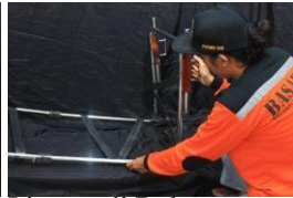
Lipatan di Buka