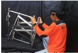
Rangka Tandu di buka

Pada rangka tandu di fungsikan untuk menahan beban korban dan menempatkan beberapa pegangan untuk Rescuer agar lebih nyaman ketika membawa korban.