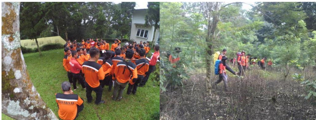
Gambar 1 penyisiran korban

Pada penyisiran ini rescuer menyisir dari berbagai medan mengikuti beberapa kordinat yang sudah di tentukan oleh pos komando. Pada tahapan ini pencarian korban paling susah di upayakan karena pada tahapan ini posisi korban tidak bisa ditentukan. Berpindah – pindahnya posisi korban merubah kordinat saat pencarian.