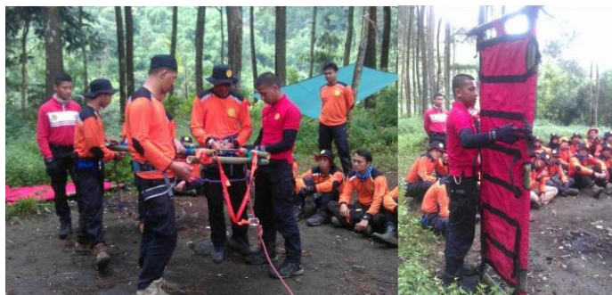
Gambar 2 Pemasangan Alat

Pemasangan alat pada saat korban di temukan, tindakan evakuasi di tentukan dengan melihat bagaimana kondisi korban saat ditemukan