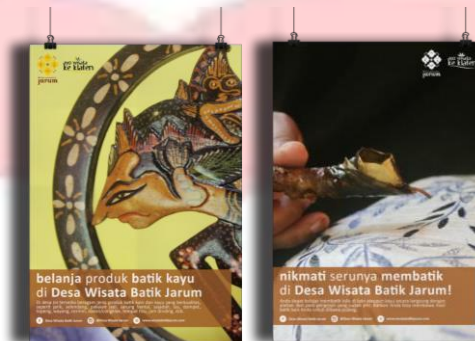
Gambar 4.11 E-poster