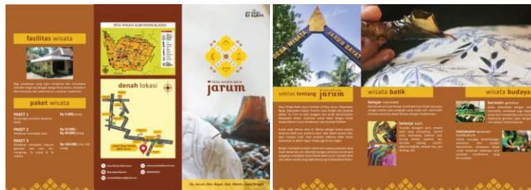
Gambar 4.10 Brosur