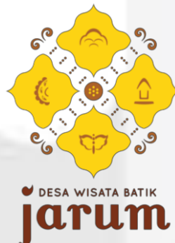
Gambar 4.5 Logo Desa Wisata Batik Jarum