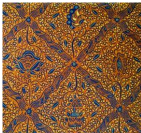
Gambar 4.1 Batik Motif Sidomukti

Jenis logo yang digunakan adalah combination mark yang elemen gambarnya diambil dari salah satu motif klasik batik yang masih sering diproduksi di Desa Jarum, yaitu motif Sidomukti. Motif ini dipilih karena menerapkan filosofi Jawa kuno yaitu “Keblat Papat Lima Pancer” yang menyimbolkan keseimbangan dan harapan agar hidup senantiasa diberikan kemakmuran. Ia juga menggambarkan harapan agar setiap elemen masyarakat di Desa Jarum dapat saling mendukung, bekerjasama serta bersinergi secara harmonis dan seimbang untuk mewujudkan sebuah desa wisata budaya sekaligus edukasi batik, serta bermanfaat baik bagi perkembangan dan pelestarian batik tulis Jarum, bagi masyarakat sekitar, dan bagi masyarakat luas.