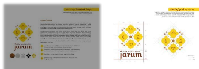
Gambar 4.6 Graphic Standard Manual