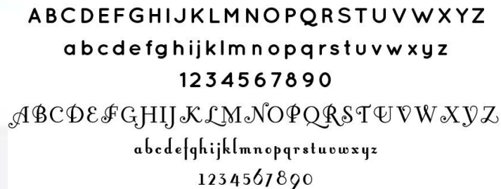
Gambar 4.3 Font Quicksand Bold dan Fontleroy Brown

Huruf yang digunakan pada logo terdiri dari dua yaitu Quicksand Bold dari jenis Neo Grotesque Sans Serif yang memiliki kesan sederhana dan masa kini, serta jenis huruf Fontleroy Brown dari jenis Decorative yang memberi kesan indah dan ornamental.