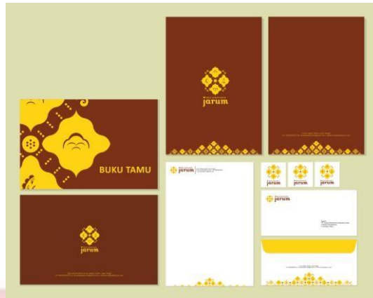
Gambar 4.7 Stationery