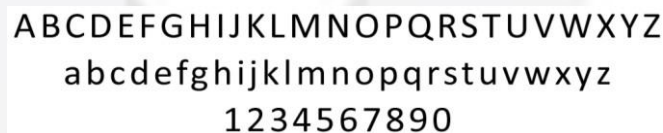
Gambar 4.4 Font Calibri

Huruf Calibri dari jenis Sans Serif yang memiliki kesan sederhana, lugas dan masa kini digunakan pada media promosi. Penggunaan jenis huruf ini pada media promosi akan dapat memberikan legibility dan readability yang lebih baik.