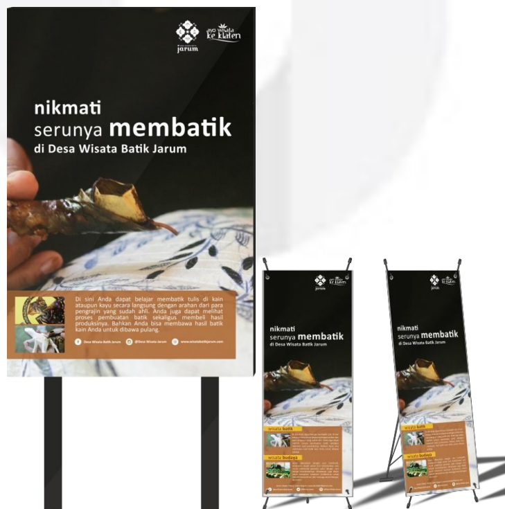
Gambar 4.9 Baliho dan x-banner