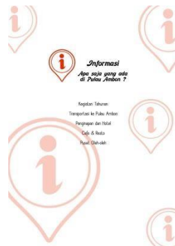
Gambar 5.3. Penerapan Warna dalam Buku

Warna merupakan salah satu unsur visual yang penting dalam sebuah desain yang dapat membuat sebuah karya desain tampil menarik. Pada perancangan buku panduan wisata Pulau Ambon ini, penulis akan menggunakan beberapa warna, seperti : biru yang terinspirasi dari warna laut dan langit, kuning dan jingga yang terinspirasi dari warna sunset/sunrise yang dilihat dari salah satu hasil fotografi dalam buku ini, warna hijau yang terinspirasi dari warna logo pemerintahan Provinsi Maluku, dan warna merah yang terinspirasi dari warna kain berang pada penari cakalele ( tarian daerah Maluku ) yang memiliki arti keberanian.