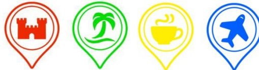
Gambar 5.2. Hasil Perancangan Ikon

Selain ilustrasi, penulis juga menggunakan ikon sebagai petunjuk informasi tempat wisata. Ikon ini akan digunakan dalam lembar transisi yang dapat membedakan tujuan wisata sesuai jenisnya dan juga sebagai petunjuk dalam infografis. Ikon yang digunakan adalah ikon pin yang terinspirasi dari ikon pin dalam google maps . Penulis merancang ikon pin yang lebih sederhana dan lebih menarik yang dipadukan dengan ilustrasi.