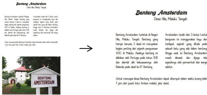
Gambar 5.4. Penerapan Warna dalam Buku

Pada perancangan cover buku panduan wisata Pulau Ambon ini, penulis menggunakan gambar tugu dari salah satu pahlawan nasional Indonesia asal Maluku yaitu Martha Christina Tiahahu. Gambar dari hasil fotografi ini berkonsep siluet dengan panorama sunset langit di Ambon pada sore menjelang malam. Penggunaan potrait pahlawan Christina ini untuk mengenalkan pahlawan asal Maluku ini serta menggambarkan sejarah yang juga dibahas dalam buku ini.