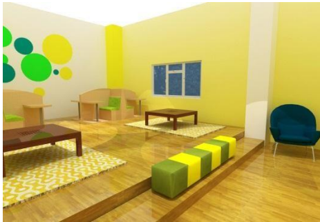
Gambar 8. Ruang Perpustakaan

Ruang perpustakaan didominasi warna kuning dan hijau (meningkatkan mood, motivasi dan ketenangan). Penggunaan mural dan ombre pada dinding dengan cat water based. Menggunakan lantai vinyl motif kayu. Pencahayaan buatan lampu TL.