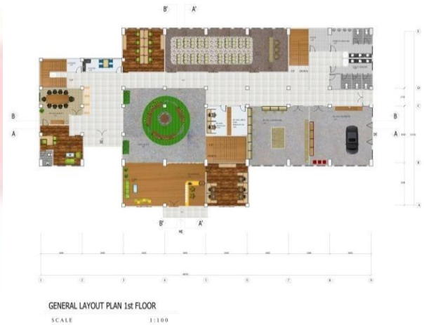
Gambar 3. Denah Umum Lantai 1

Rumah perlindungan anak jalanan terdiri dari tiga lantai. Lantai pertama terdapat area lobby, area kantor, aula, ruang workshop dan juga area berkumpul. Lantai satu ini difokuskan pada kantor dan juga area yang bersifat publik untuk berkumpul dalam jumlah yang besar. Terdapat area berkumpul dan bermain dibagian tengah bangunan sebagai central aktivitas di lantai 1.