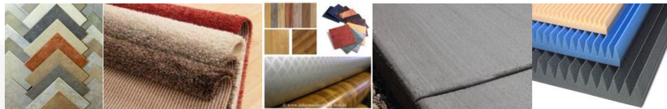
Gambar 1. Konsep material

Material yang digunakan pada Rumah Perlindungan Anak Jalanan adalah material yang aman dan nyaman bagi penghuni khususnya anak-anak. Penggunaan material juga diperhatikan untuk setiap ruang disesuaikan dengan fungsinya masing-masing. Penggunaan material dalam interior Rumah Perlindungan Anak Jalanan diantaranya Lantai : keramik, karpet, parket dan concrete finishing , vinyl. Dinding : finishing cat, wallpaper, plester semen, material akustik dinding (Acourete Board Panel). Ceiling : gypsum board , panel akustik. Furniture : kayu (solid dan olahan), kaca, stainless.