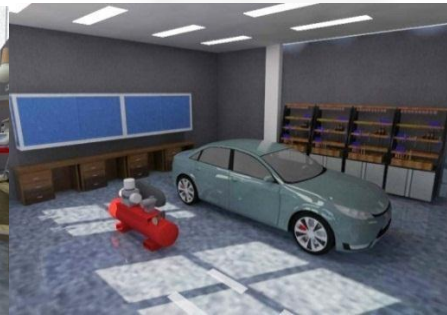
Gambar 7. Ruang Otomotif

Ruang keterampilan elektro dan otomotif menerapkan konsep dengan penggunaan dinding plesteran yang sudah difinishing dengan concrete finishing cat water based, rak peralatan untuk ruang otomotif dengan finishing cat besi water based. Untuk meja dan ambalan menggunakan multipleks dengan finishing hpl. Untuk Pemilihan material lantai, karena ruang ini memiliki tingkat kerja yang tinggi. Material yang digunakan adalah material yang kasar. Karakteristik material lantai concrete yang kuat tekan dan tahan temperature ringgi cocok digunakan untuk ruangan ini. Pencahayaan dan penghawaan yang digunakan adalah alami dan buatan. Alami berasal dari bukaan jendela dan pintu. Untuk penghawaan buatan digunakan exhaust fan untuk membantu sirkulasi udara. Pencahayaan buatan menggunakan lampu TL sebagai general lighting.