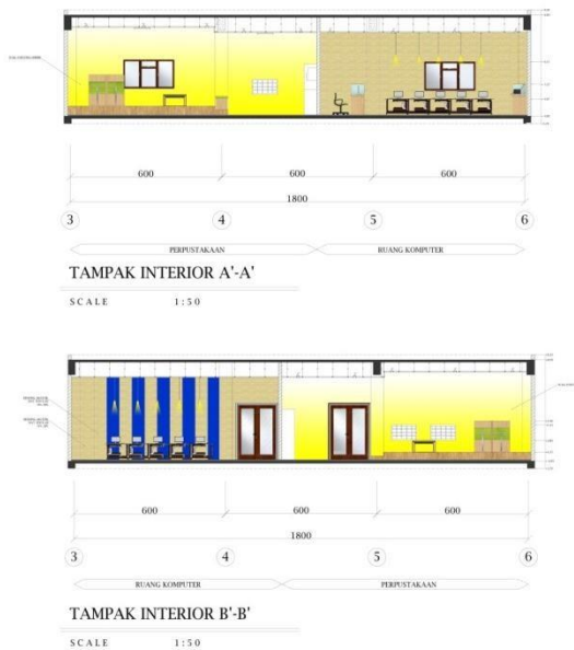
Gambar 11. Tampak ruang komputer dan perpustakaan