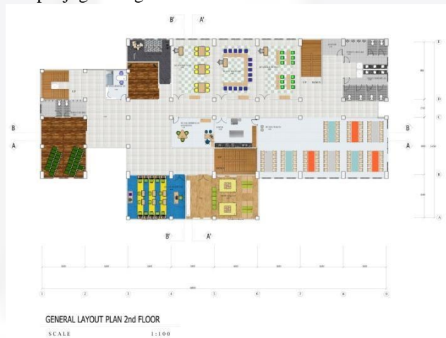
Gambar 4. Denah Umum Lantai 2

Pada lantai dua, difokuskan pada fungsi edukasi untuk anak binaan. Yaitu terdapat ruang kelas, dari mulai SD sampai SMA, ruang tari, ruang musik, perpustakaan, ruang komputer, ruang kesehatan dan bimbingan konseling dan terdapat juga ruang makan.