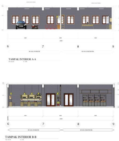
Gambar 10. Tampak ruang otomotif dan elektro