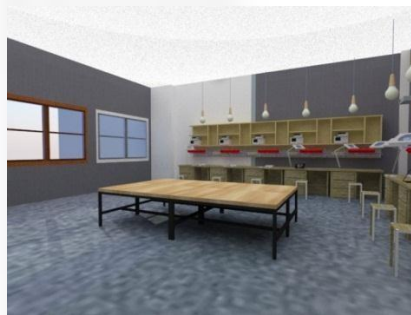
Gambar 6. Ruang Elektro

Denah khusus yang dipilih dalam perancangan rumah perlindungan anak jalanan ini adalah area ruang keterampilan yang dapat menunjang bakat anak binaan. Ruang ini dipilih karena rumah perlindungan anak jalanan ini fokus pada pengembangan diri bagi anak binaan, sehingga ruang-ruang keterampilan yang menjadi icon dan mencerminkan rumah perlindungan anak jalanan ini. Ruang keterampilan atau pengembangan bakat ini terdiri dari ruang pengembangan bakat untuk bidang eletronik, otomotif, seni musik, seni tari, laboratorium komputer, perpustakaan dan juga ruang kelas belajar.