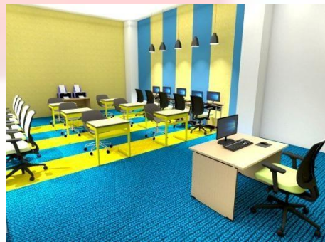
Gambar 9. Ruang Komputer

Ruang komputer menggunakan material dinding panel akustik untuk menghindari terjadinya gema ditambah dengan hiasan mural. Digunakan juga karpet untuk meredam suara. Menggunakan pencahayaan dan penghawaan buatan.