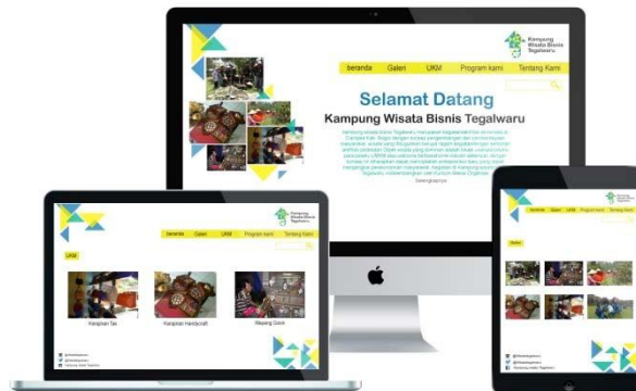
Gambar 5.6 Website.