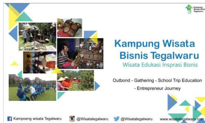
Gambar 5.7 Billboard