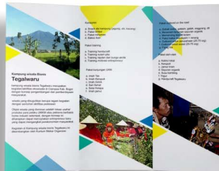
Gambar 5.4 leaflet kampung wisata bisnis Tegalwaru