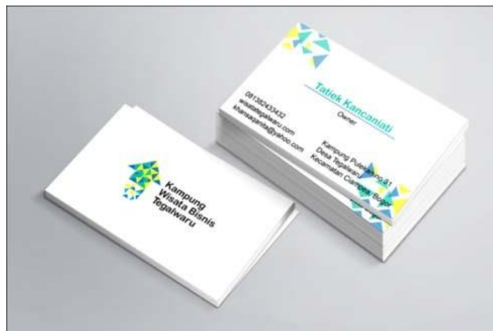
Gambar 5.2 Kartu nama