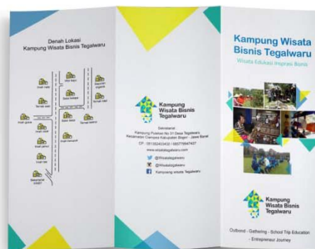
Gambar 5.5 leaflet kampung wisata bisnis Tegalwaru