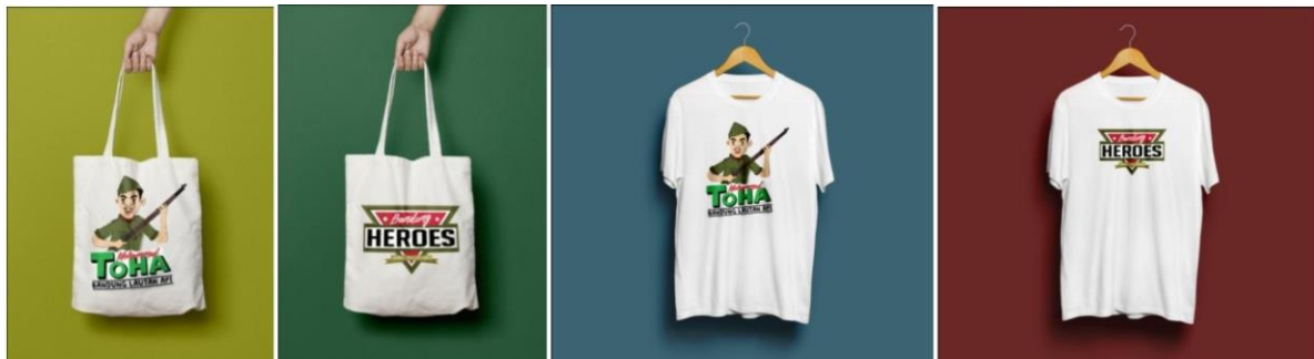
Gambar 7 tote bag, t-shirt