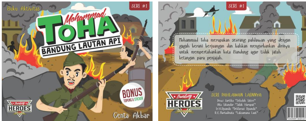
Gambar 3 cover depan dan cover belakang