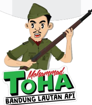
Gambar 1 Gaya kartun