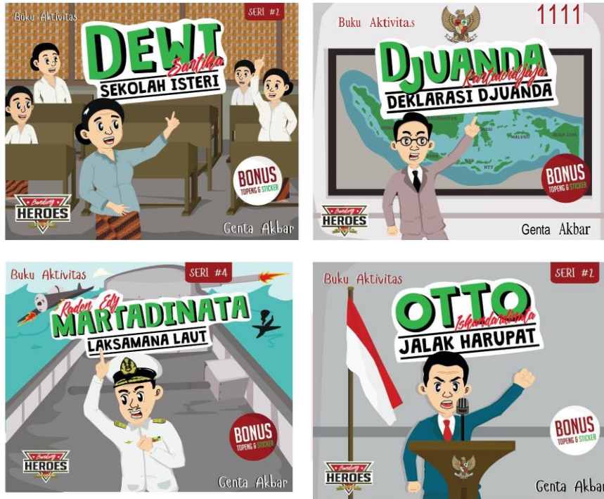
Gambar 5 seri buku pahlawan