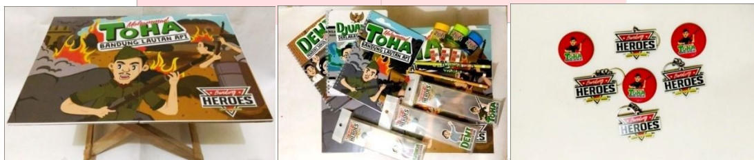
Gambar 9 meja belajar, alat tulis, pin & gantungan kunci