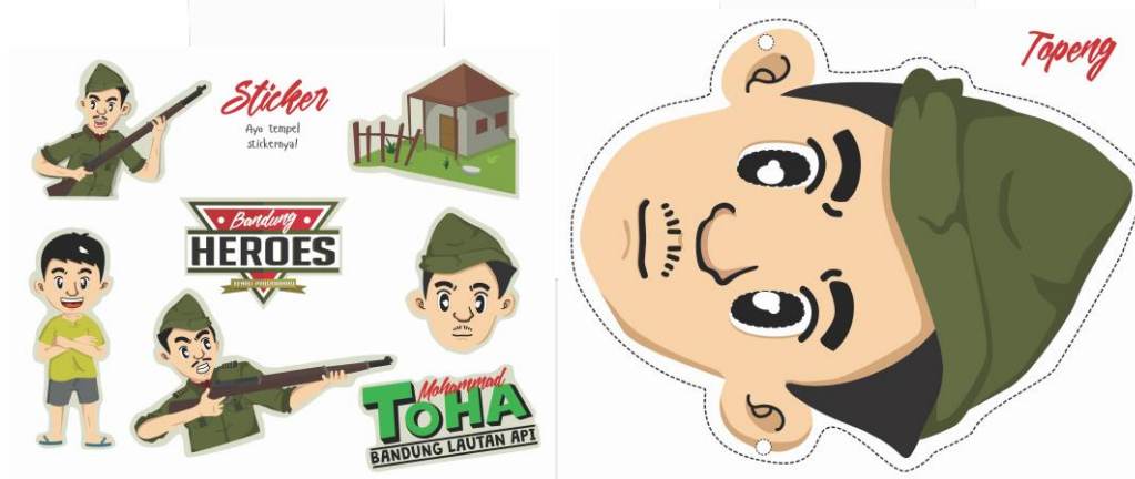
Gambar 10 sticker dan topeng