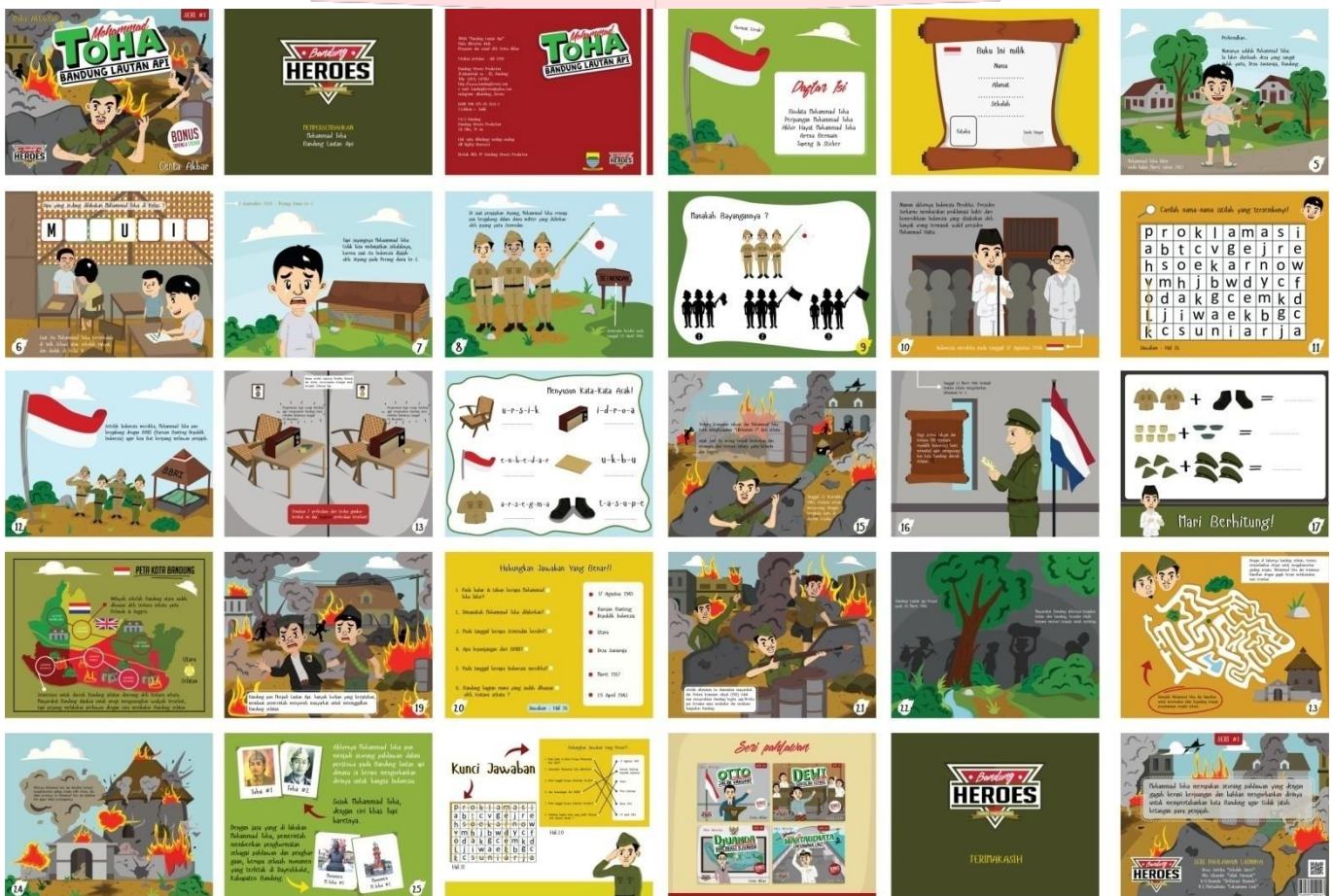
Gambar 4 isi buku