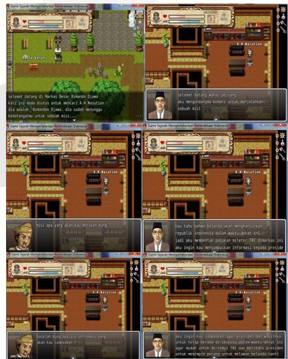
Gambar 3.5 Level 2.