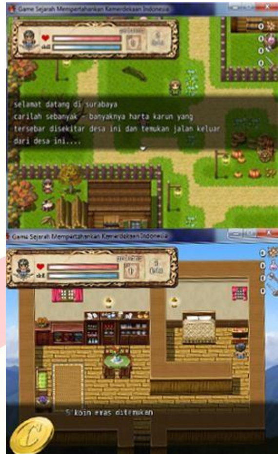
Gambar 3.4 Surabaya.