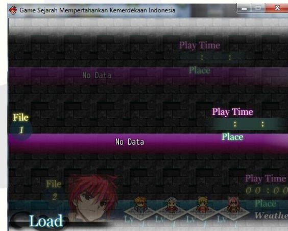
Gambar 3.2 Database Game.