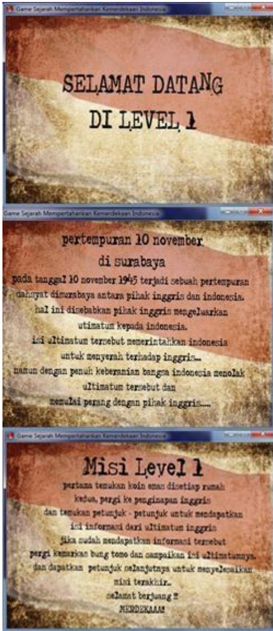
Gambar 3.3 level 1.