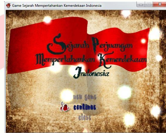
Gambar 3.1 Tampilan Awal.