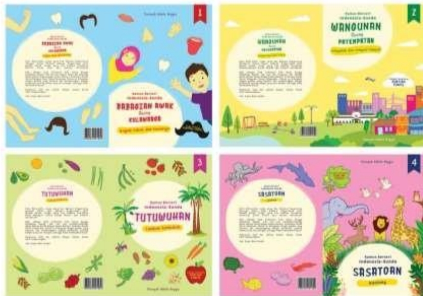
Gambar 1 Cover Kamus Visual Berseri Indonesia-Sunda (Searah Jarum Jam dari Kiri Atas) Cover Seri Babagian Awak jeung Kulawarga, Cover Seri Wangunan jeung Patempatan, Cover seri Tutuwuhan, Cover seri Sasatoan

Berikut beberapa contoh halaman hasil rancangan Kamus Visual Berseri Indonesia-Sunda.