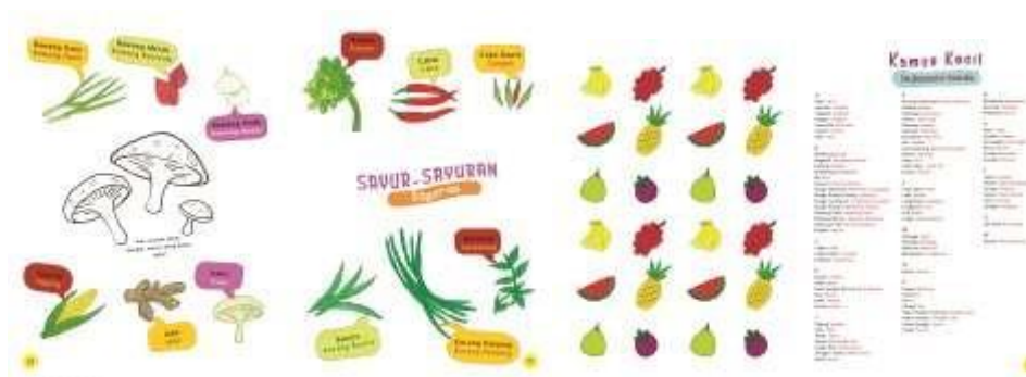
Gambar 3 Hasil Perancangan (Kanan) Halaman 18-19 Kamus Tutuwuhan (Kiri) Halaman 26-27 Kamus Tutuwuhan