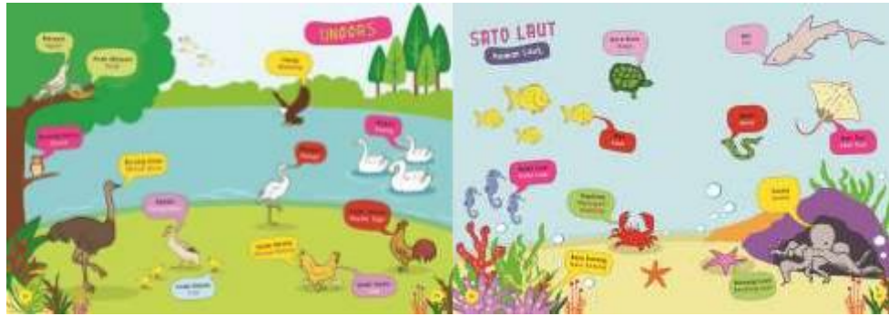
Gambar 4 Hasil Perancangan (Kanan) Halaman 14-15 Kamus Sasatoan (Kiri) Halaman 16-17 Kamus Sasatoan