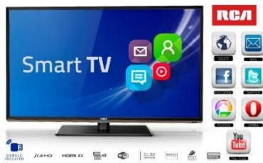
Gambar 2 - 2 Contoh Smart TV dengan beberapa layanan berbasis internet

Smart TV memberikan konten (seperti foto, film dan musik) dari komputer lain atau jaringan terpasang penyimpanan perangkat pada jaringan baik menggunakan Digital Living Network Alliance / Universal Plug and Play media server atau program layanan serupa seperti Windows Media Player atau Network Attached storage (NAS) , atau melalui iTunes. Hal ini juga menyediakan akses ke layanan berbasis internet termasuk saluran TV siaran lokal, layanan catch-up , video-on-demand (VOD) , panduan program elektronik, iklan interaktif, personalisasi, suara, game , jejaring sosial, dan aplikasi multimedia lainnya[6].