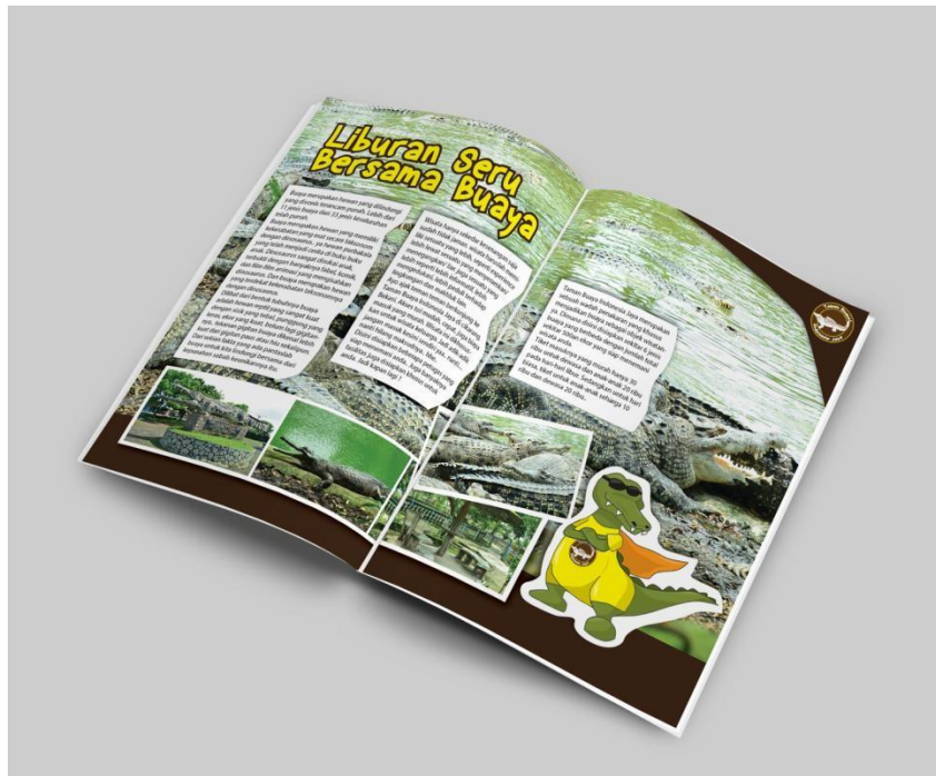
Gambar 4.6 Iklan Majalah