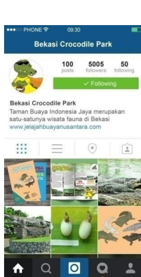
Gambar 4.4 Halaman Instagram