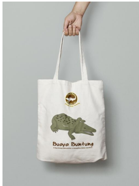
Gambar 4.12 Tote Bag