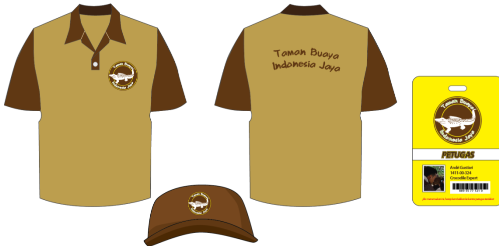
Gambar 4.20 Seragam