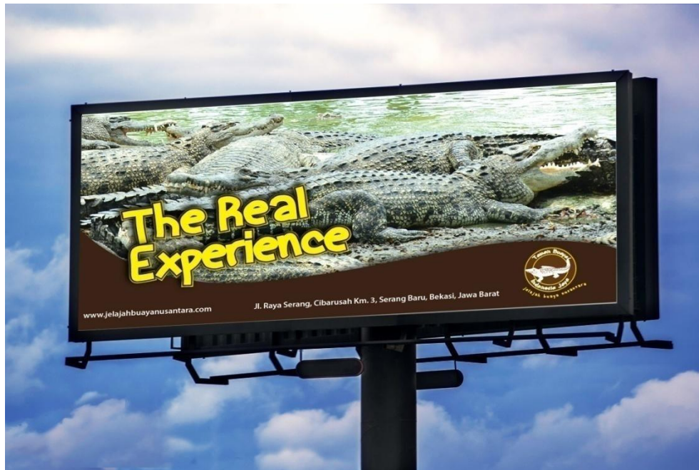
Gambar 4.8 Billboard