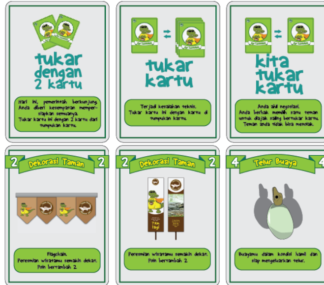
Gambar 4.11 Kartu Kejutan