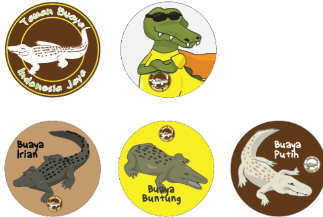
Gambar 4.17 Pin