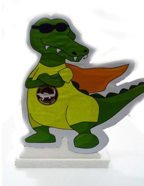
Gambar 4.13 Standing Mascot