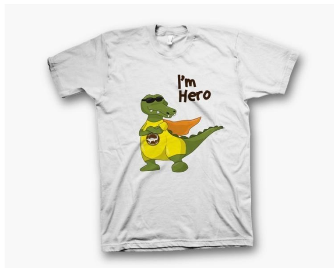
Gambar 4.14 Kaos