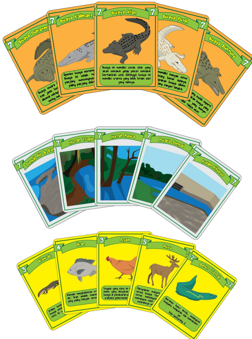
Gambar 4.10 Kartu dalam permainan kartu