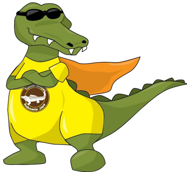
Gambar 4.2 Maskot Taman Buaya Indonesia Jaya