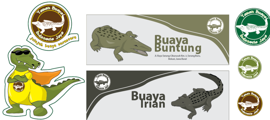
Gambar 4.18 Stiker