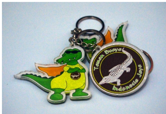
Gambar 4.16 Gantungan Kunci