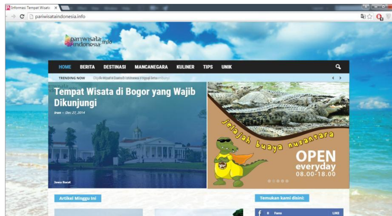
Gambar 4.5 Web Banner