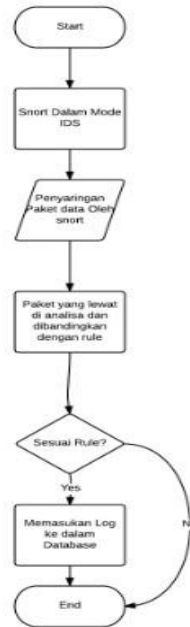
Gambar 3.1 Flowchart Desain Utama

Sistem yang dibangun adalah Intrusion Prevention System Berbasis sebuah system yang menggunakan software open source yaitu Snort. Semua paket-paket yang melewati jaringan akan disaring dengan rule-rule yang ada pada Snort sehingga ketika sebuah penyerangan terjadi dan tersaring oleh rule, paket tersebut akan di drop menggunakan firewall dan rule tersebut tersimpan didalam log database.