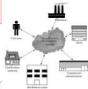
Gambar 2.1 Komponen E-commerce [1]

[1] Aktivitas perdagangan yang menggunakan teknologi informatika adalah e-commerce .