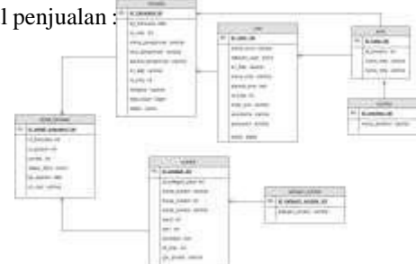
Gambar 4. 2 ERD

Berikut adalah ERD e-commerce Angon modul penjualan :