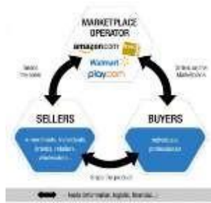
Gambar 2. 2 Ilustrasi Marketplace [2]

[2] Marketplace adalah tempat bertemunya penjual dan pembeli untuk saling bertransaksi baik itu barang ataupun jasa. Transaksi yang terjadi didalam marketplace dikelola langsung oleh pihak manajemen marketplace . Marketplace menyediakan pengelolaan pembayaran, katalog penjualan, stok produk dan informasi mengenai pembeli dan penjual yang sudah diverifikasi oleh pihak manajemen. Selain itu harga yang sudah ditetapkan pada marketplace sudah tetap artinya tidak terjadi tawar menawar. Berikut adalah ilustrasi marketplace :