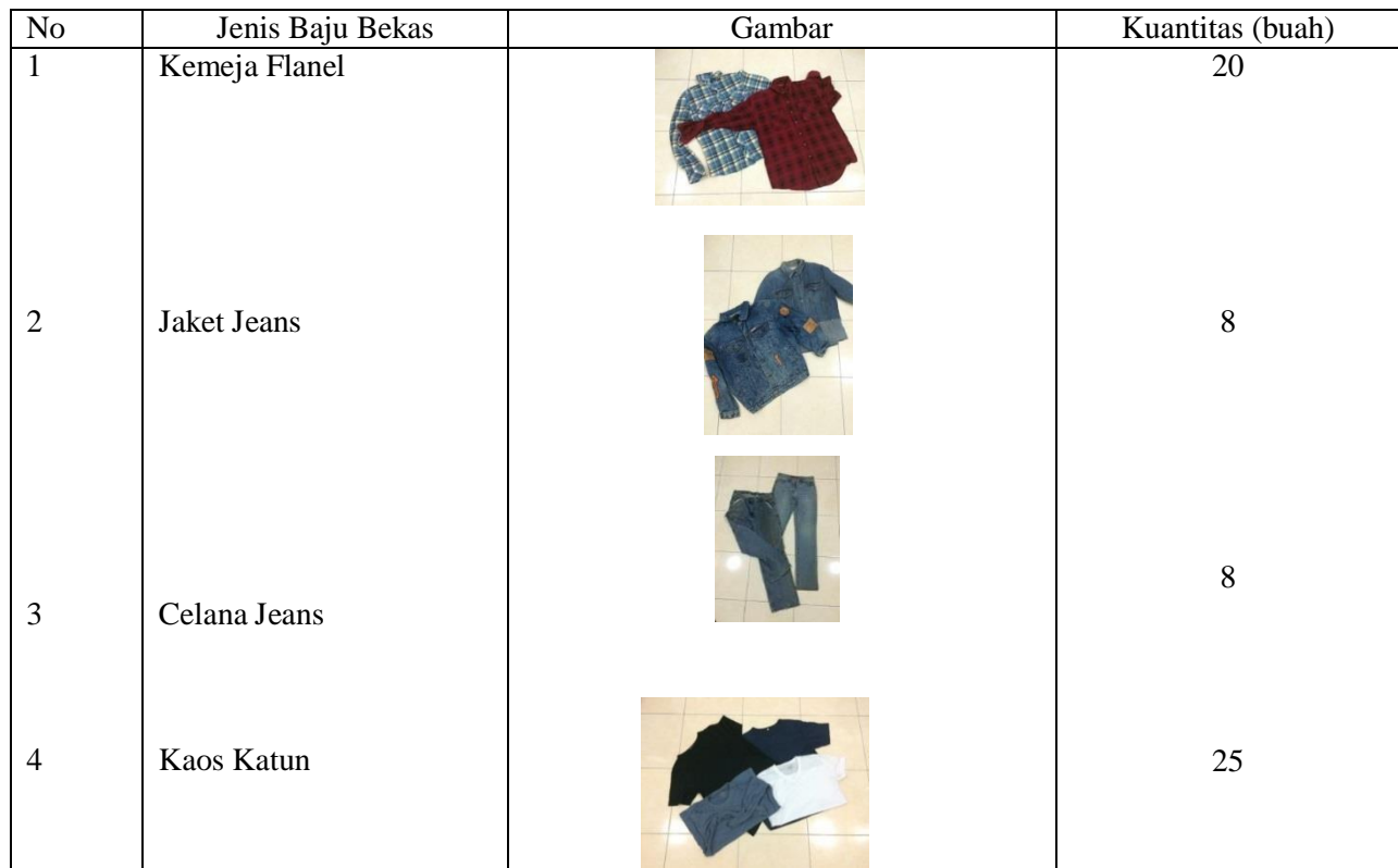
Tabel 2.1 Material dan Kuantitas Sumber : Timothy Wen, 2016

namun kenyataannya baju tersebut masih bisa dipakai (WRAP,2011) Baju bekas biasanya dapat ditemukan di berbagai tempat dan menjadi penyokong ekonomi bagi sebagian orang. Di Bandung khususnya tempat penjualan baju bekas terdapat di pasar Gede bage. Pasar ini sudah lama di kenal sebagai tempat penjualan baju bekas.