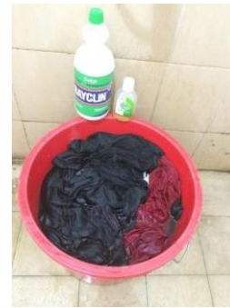
Gambar 3.1 Persiapan Baju Bekas Sumber : Timothy Wen, 2016

Baju bekas biasanya datang dalam keadaan yang masih kotor ataupun terkontaminasi dengan banyak debu dan sebagainya, dikarenakan kondisi tempat penjualan juga berbagai faktor lainnya. Untuk mencegah reaksi yang kurang baik pada kulit manusia pakaian bekas itu ditindaklanjuti dengan pemberian desinfektan pada air panas lalu pakaian bekas tersebut direndam , lalu setelah itu proses pencucian dilanjutkan.