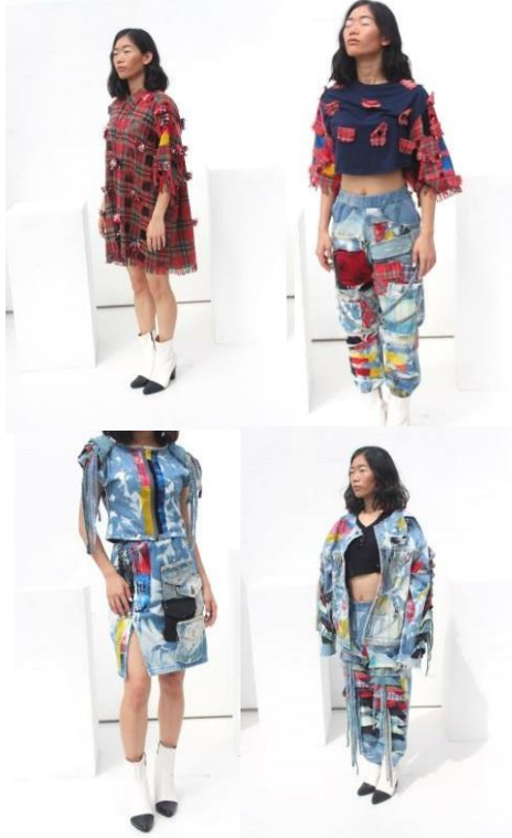
Gambar 4.1 Hasil Pengolahan Baju Bekas

Hasil dari penelitian ini adalah produk fashion seperti berikut.