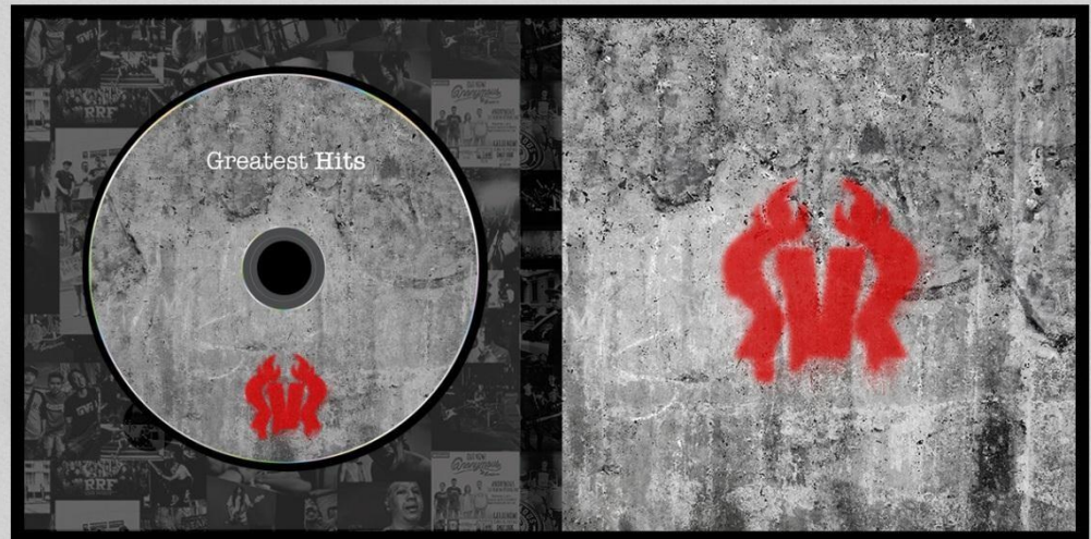
Gambar 1. Konstruksi Buku

Penempatan cd-kompilasi dari lagu-lagu terbaik rilisan Reach & Rich Records pada bagian depan buku dimaksudkan untuk memudahkan konsumen jika ingin mendengarkan karya-karya terbaik yang dihasilkan oleh band-band yang ada di Reach & Rich Records sambil membaca buku tersebut.