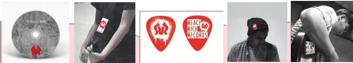
Gambar 5. Media Pendukung

Media pendukung yang digunakan merupakan paket bundling meliputi CD kompilasi, pick gitar, strap gitar, beanie, kaos, dan sticker.