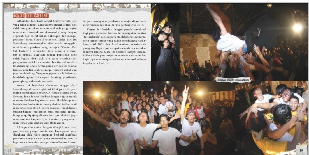
Gambar 3. Contoh Layout Buku

Layout buku secara keseluruhan menggunakan keseimbangan asimetris yang bertujuan untuk memberikan kesan muda, dinamis, dan tidak monoton berkaitan dengan jenis musik yang diusung yaitu pop-punk yang erat kaitannya dengan anak muda.