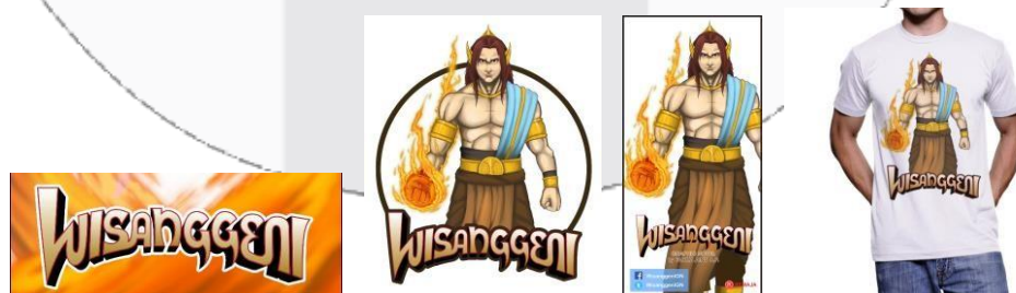
Gambar 5. Media Pendukung

Media pendukung yang bersifat promosional, menggunakan poster, x-banner, dan media sosial. Terutama pemanfaatan media sosial yang dekat dengan target remaja yang diharapkan bisa efektif untuk mengenalkan novel grafis ini. Untuk x-banner dan poster bisa digunakan pada event atau pameran karena secara visual menarik pengunjung untuk melihat media utama yaitu novel grafis. Media pendukung lainnya bersifat merchandise karena media tersebut bersifat dimiliki dan diberikan atau diperjual belikan kepada khalayak pada waktu tertentu.