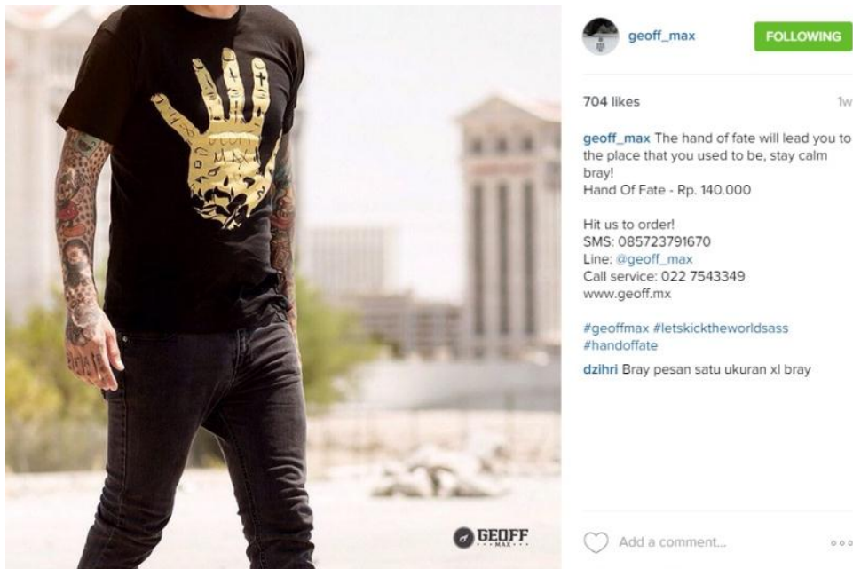
Gambar 1.3 Contoh Quote dalam Instagram @geoff_max