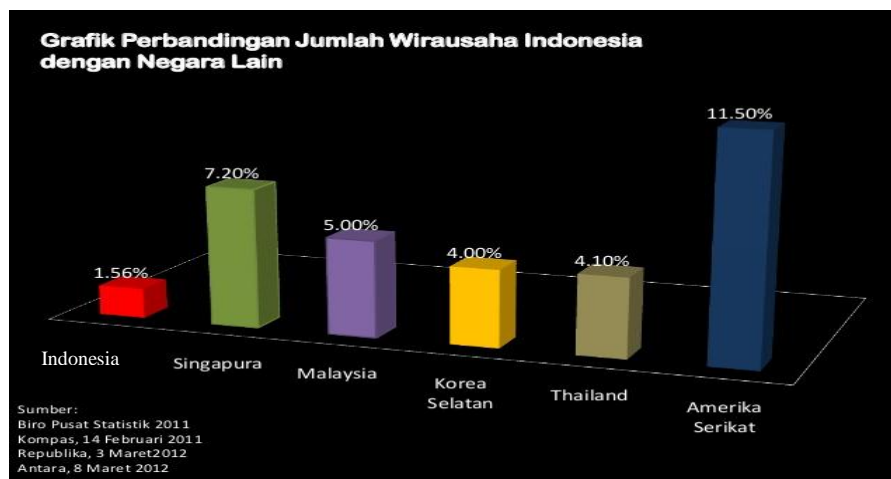
Gambar 1.1 Grafik Perbandingan Jumlah Pengusaha Indonesia Dengan Negara Lain