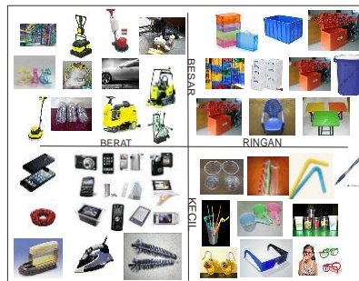
Gambar 3.3 Image Chart