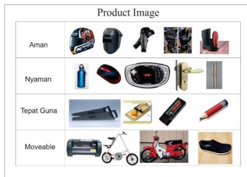
Gambar 3.5 Product Image

Semua data produk kompetitor kemudian dirangkum dan dibuatkan product image atau citra produk. Product image merupakan kumpulan produk-produk yang memiliki pencitraan atau style serupa dengan produk yang akan dirancang namun tidak memiliki fungsi sama.