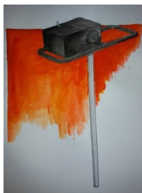
Gambar 3.6 Final Design

Dari hasil eksperimen bentuk, didapatkan final desain sebagai berikut :