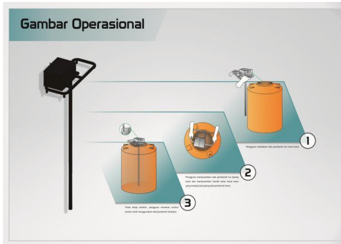
Gambar 3.7 Penjelasan Produk

Produk perahu karet ini dapat di jadikan tempat tidur maupun sofa atau tempat duduk sebagai alternatif penyimpanan saat keadaan tidak terpakai.