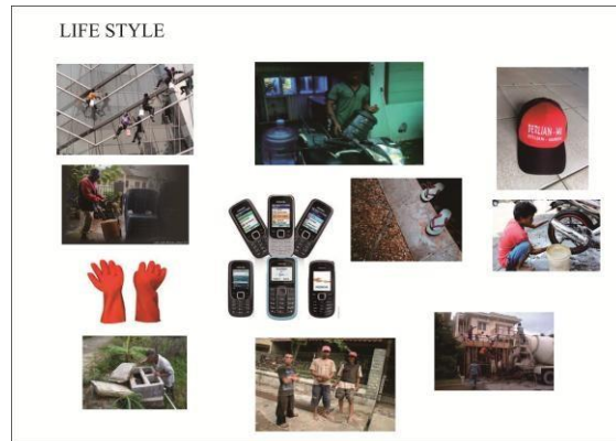
Gambar 3.4 Lifestyle Image

Setelah analisis citra sudah dilakukan, selanjutnya adalah membuat lifestyle image yang merupakan kumpulan gambar-gambar yang berkaitan dengan gaya hidup end user baik dari produk rumah tangga, lingkungan, profesi, aktivitas, hingga sarana prasarana yang digunakan.