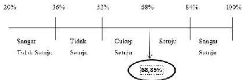
Gambar 3. Garis Kontinum Brand Image

Berdasarkan daerah kontinum, tanggapan responden terhadap brand image yang dilakukan oleh The Body Shop di store Festival Citylink terletak pada daerah kontinum yang setuju, yaitu antara interval 68% - 84%. Sehingga dapat disimpulkan bahwa tanggapan konsumen terhadap brand image yang dilakukan The Body Shop di store Festival Citylink sudah berjalan dengan baik. Hasil ini dapat disimpulkan bahwa adanya pengaruh brand image terhadap responden The Body Shop dimana hal tersebut dapat di ambil berdasarkan tanggapan dari para konsumen yang mulai peduli terhadap lingkungan sekitar serta mendukung program-program yang berkonsep