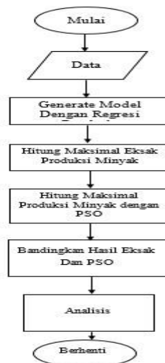
Gambar 1 Flow Chart Sistem optimasi multiwell gas lift dengan algoritma PSO

Berikut adalah alur kerja perancangan sistem: