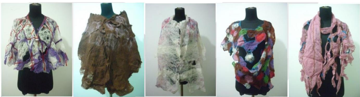
Gambar 6. Visualisasi Karya