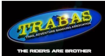
Gambar 1. Komunitas Trail Bandung

TRABAS atau Trail Adventure Bandung Association adalah suatu wadah komunitas kendaraan bermotor yang pertama di Bandung didirikan pada 15 September 1995. TRABAS adalah organisasi yang berbentuk kesatuan yang bergerak secara aktif di bidang olahraga Adventure offroad petualang, social, yang berhubungan dengan kendaraan bermotor dengan sifat beralaskan asas kekeluargaan, gotong royong dan mandiri.