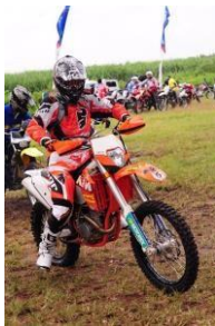
Gambar 2 Pengendara Motor Trail

TRABAS atau Trail Adventure Bandung Association adalah suatu wadah komunitas kendaraan bermotor yang pertama di Bandung didirikan pada 15 September 1995. TRABAS adalah organisasi yang berbentuk kesatuan yang bergerak secara aktif di bidang olahraga Adventure offroad petualang, social, yang berhubungan dengan kendaraan bermotor dengan sifat beralaskan asas kekeluargaan, gotong royong dan mandiri.