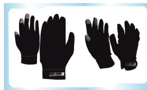
Gambar 5 Desain Akhir dan Produk