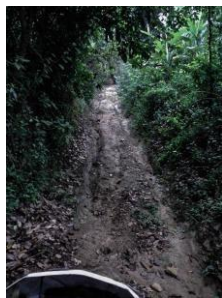
Gambar 3 Lokasi Kegiatan Offroad

Salah satu objek penelitian yang sedang diteliti oleh penulis dalam perancangan ini yaitu pengendara motor trail pada komunitas TRABAS.