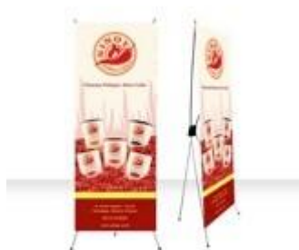
Gambar 5.7 X-Banner