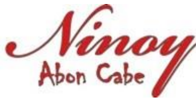
Gambar 3.0 Logo Ninoy Abon Cabe