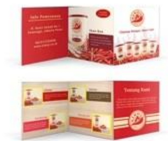
Gambar 5.6 Brosur