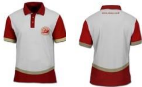
Gambar 5.13 Seragam Pegawai