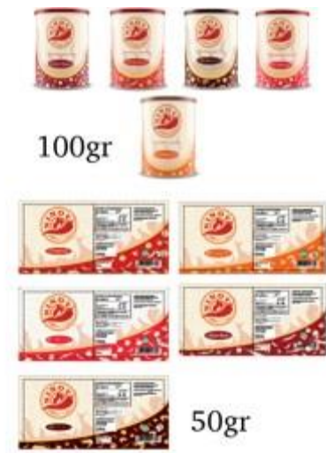
Gambar 5.8 Desain Kemasan