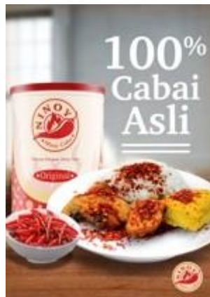
Gambar 5.5 Poster