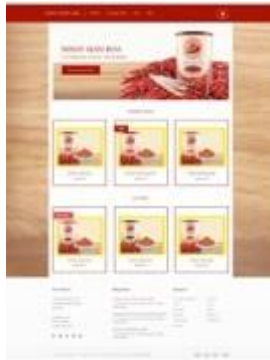
Gambar 5.10 Website Interface