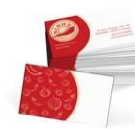
Gambar 5.3 Kartu Nama