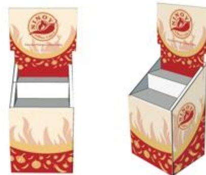
Gambar 5.15 Pop Display