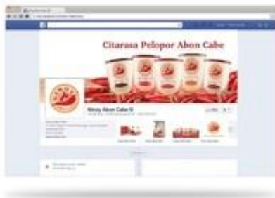
Gambar 5.11 Facebook