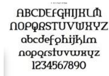
Gambar 4.7 Font Amerika 1