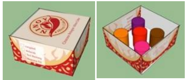
Gambar 5.14 Secondary Packaging