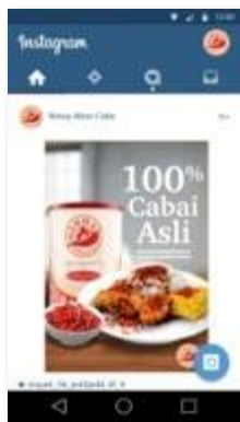
Gambar 5.12 Instagram