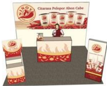
Gambar 5.17 Booth