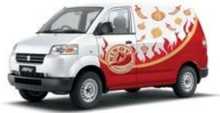
Gambar 5.16 Stiker Mobil