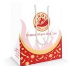
Gambar 5.9 Shopping Bag