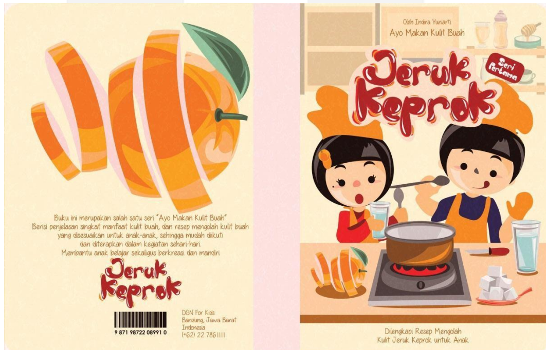
Gambar 3.2. Desain Sampul Depan dan Belakang