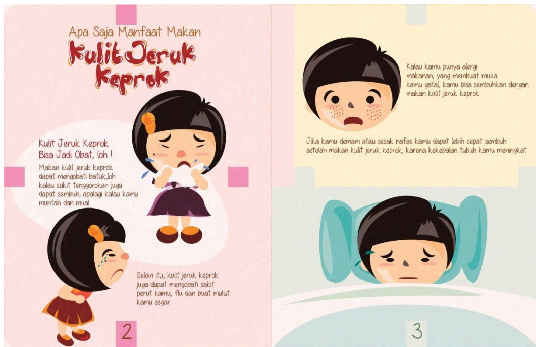
Gambar 3.4. Desain halaman 2 dan 3