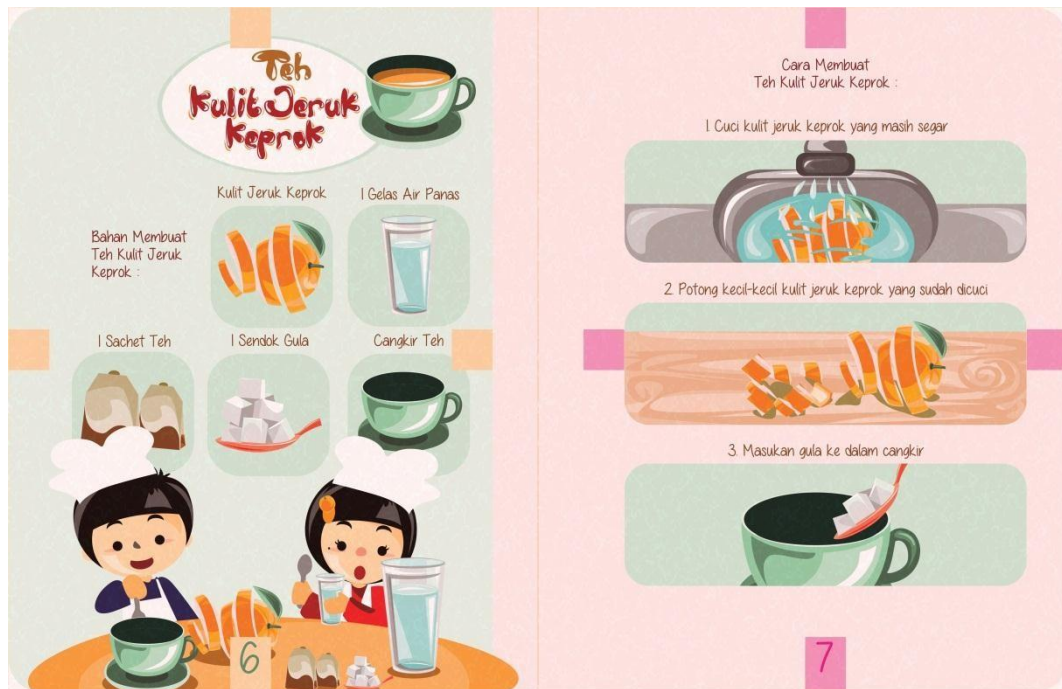
Gambar 3.5. Desain Halaman 6 dan 7