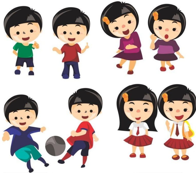
Gambar 3.1. Karakter dalam buku