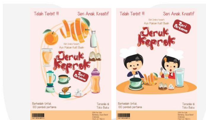
Gambar 4.23. Desain media pendukung berupa poster