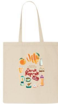
Gambar 4.21. Desain media pendukung berupa totebag