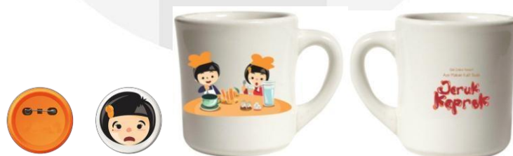
Gambar 4.20. Desain media pendukung berupa mug dan pin (Sumber: Dokumentasi Penulis)