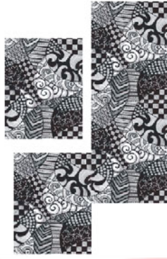
Gambar 4. Motif dengan pengulangan bagan setengah langkah