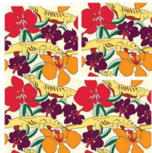
Gambar 2. Motif dengan pengulangan bagan satu langkah (Sumber : Dokumen pribadi)

Pada bagan pengulangan satu langkah, ujung motif yang berakhir pada sisi atas (A) harus bertemu pada ujung motif yang berakhir pada sisi bawah (A). Demikian berlaku pada sisi lainnya, ujung motif yang berakhir pada sisi kiri (B) harus bertemu pada ujung motif yang berakhir pada sisi kanan (B).