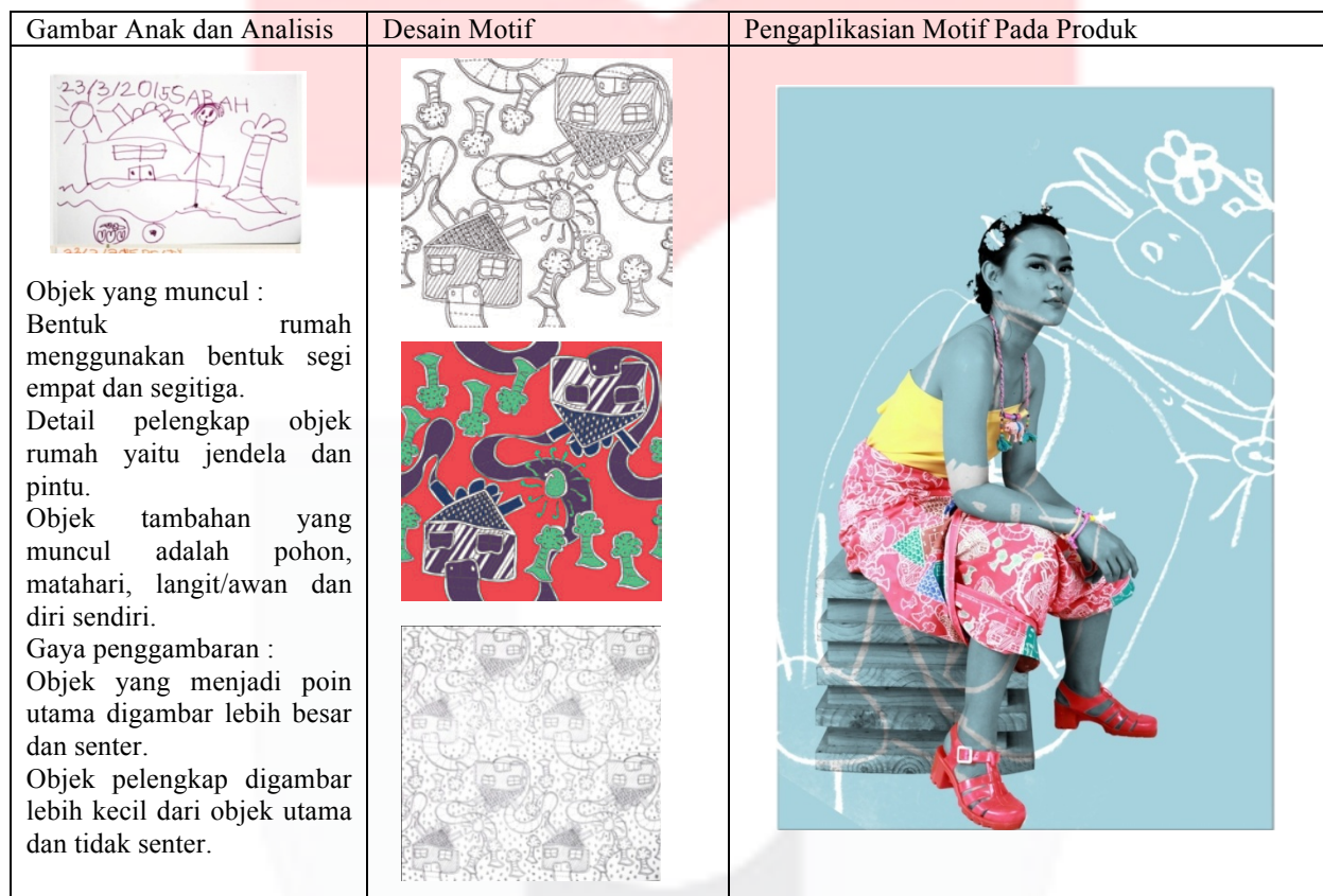
Tabel 2. Desain motif sesuai dengan analisa gambar dan pengaplikasian motif pada produk.

Pada karya pengolahan motif gambar anak dengan teknik batik ini pengaplikasiannya dibatasi hanya pada sebuah kain panjang dengan tujuan agar motif yang diripitasi dapat terlihat utuh serta kombinasi motif cap dan motif tulis lebih terlihat. Namun, pengaplikasian motif ini tidak menutup kemungkinan untuk diaplikasikan pada produk fashion seperti sarung, selendang, scarf , tas, napkin dan lain-lain.