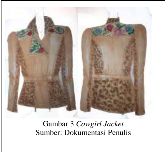
Gambar 3 Cowgirl Jacket