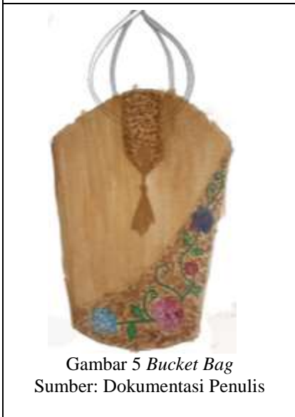
Gambar 5 Bucket Bag