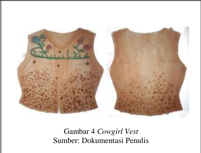
Gambar 4 Cowgirl Vest