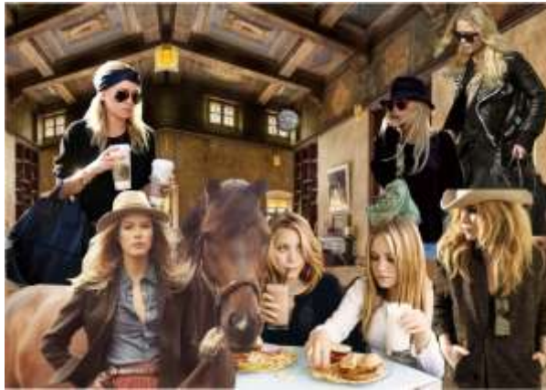
Gambar 1 Customer profile

Gaya hidup konsumen yang dituju yaitu wanita aktif yang menyukai traveling , hangout , fashionable dan memiliki hobi yang unik seperti berkuda dan bikers .