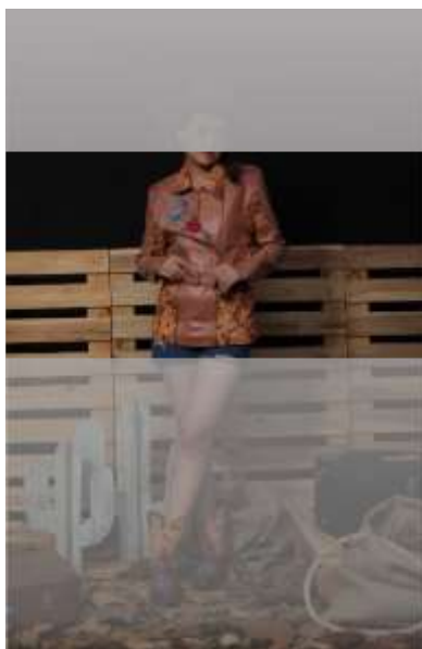
Gambar 8 Cowgirl Jacket