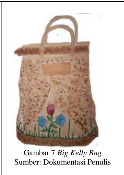
Gambar 7 Big Kelly Bag