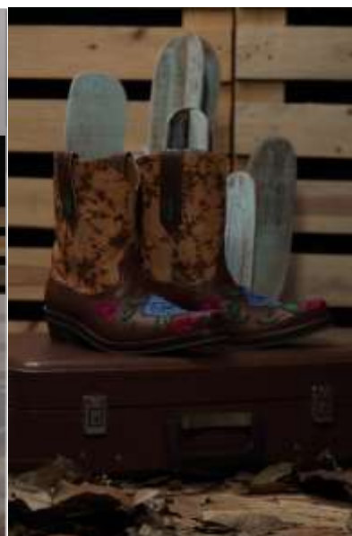
Gambar 10 Cowgirl Boots