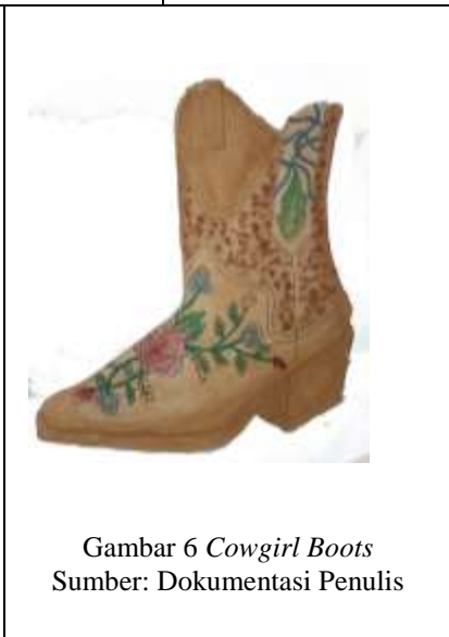
Gambar 6 Cowgirl Boots