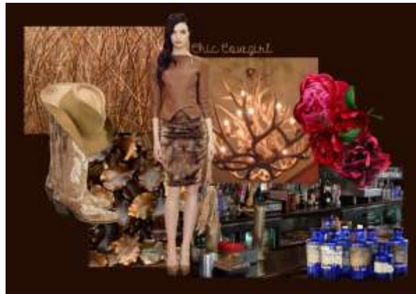
Gambar 2 Mood board dengan tema Chic Cowgirl