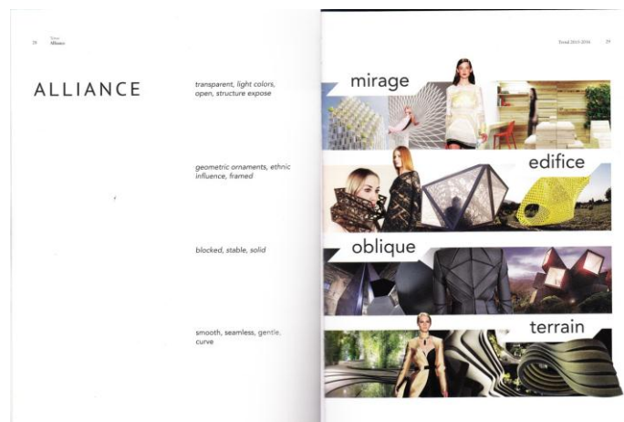
Gambar 2 (Subbab Tema Alliance)

Dalam perancangan ini penulis mengambil sub tema “Terrain” sebagai acuan dalam proses perancangan produk. Tema “Terrain” ini disebutkan bahwa spiritualisme dengan pengertian akan perubahan alam, cuaca, pergerakan air, dan kontur tanah yang tidak bisa dilepaskan telah memberikan inspirasi pada perancangan dengan garis-garis lengkung yang berjalan paralel seirama yang memberikan ketenangan dan rasa nyaman.