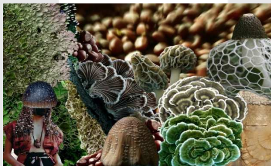
Gambar 2. Image board

Image board menampilkan gambaran konsep perancangan seperti warna yang diambil serta inspirasi tekstur dan bentuk dari beragam fungi dan jamur.