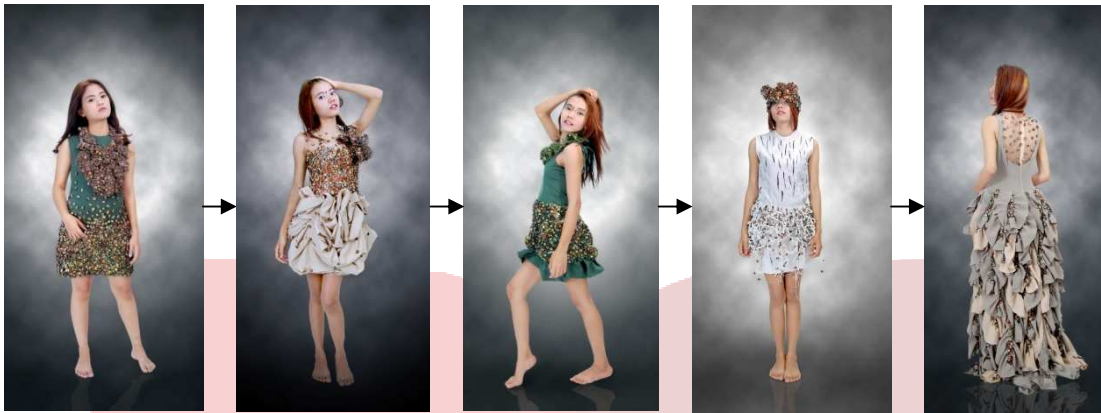
Gambar 6. Visualisasi Karya

Visualisasi karya terinspirasi dari bentuk serta tekstur jamur dan fungi, diantaranya jamur dan fungi yang masuk kedalam perancangan karya yakni : Commune mushroom, Head mushroom, Lady mushroom, Morchella crassipes, Lichen fungi, Turkey tail fungi.