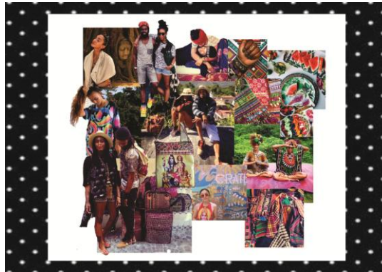
Gambar 3.2 Lifestyle