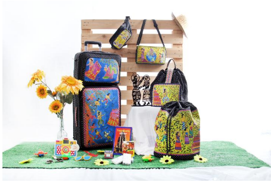
Gambar 3.4 Visualisasi Produk