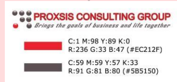
Gambar 3.1 Warna Identitas PCG

Dari analisis elemen visual yang telah dilakukan, ditemukan bahwa konsistensi menyangkut identitas perusahaan masih kurang, khususnya pada warna. Identitas sangatlah penting bagi setiap perusahaan, dan untuk membangun identitas tersebut diperlukan konsistensi khususnya dalam menggunakan warna dan tipografi, hal ini memberi kesan untuk badan perusahaan sehingga akan dengan mudah dikenali diantara kompetitornya dan tentunya dengan adanya identitas tersebut perusahaan jadi lebih mudah diingat oleh klien.