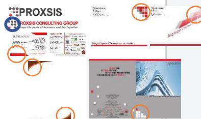
Gambar 3.2 Media Pendukung PCG

Pada logo huruf kurang memiliki ciri khas karena masih menggunakan font standar yang ada pada komputer. Untuk media pendukung sebaiknya tetap menggunakan huruf sans serif karena logo juga telah menggunakan huruf tersebut dan keterbacaan jenis huruf tersebut juga cukup baik. Sans serif sendiri memiliki kesan tegas dan artistik. Selain itu penggunaan efek pada font sebaiknya jangan terlalu berlebihan; seperti pada gambar amplop, huruf ditarik sedemikian rupa, sehingga tingkat keterbacaan berkurang. Penggunaan huruf atau font pada satu halaman media sebaiknya tidak menggunakan lebih dari 3 jenis, karena lebih dari itu akan memberikan kesan yang ramai. Hal-hal lain yang perlu diperhatikan dalam tipografi adalah ukuran huruf; sesuai dimana tulisan itu ditempatkan sehingga tidak terlalu besar dan tidak terlalu kecil. Penggunaan warna pada huruf juga harus menyesuaikan dengan background sehingga dapat dibaca dengan baik.