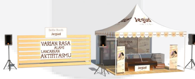
Gambar 3. Booth JegudMilk

Media yang digunakan meliputi 16 media yaitu : 1) Media Utama : Event, Media sosial(Facebook, twitter, Instagram). 2) Media pendukung : Web Banner , iklan majalah, poster, x-banner , keychain , leaflet , pamphlet , stiker, T-shirt , Marchandise , coupon , flagchain .