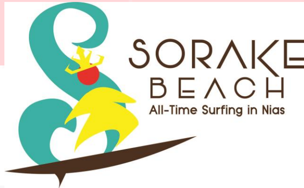
Desain Logo Pantai Sorake

Penulis mengangkat karakteristik utama dan alasan para peselancar datang ke Pantai Sorake, yaitu konsistensi ombaknya yang dapat dipakai berselancar sepanjang tahun. Bentuk ombaknya sendiri dimodifikasi dan membentuk huruf "S" yang berasal dari kata Sorake. Huruf yang digunakan adalah jenis Vinoque 64 dan Typo Groteks . Mahkota pada siluet peselancar merupakan perhiasan kepala yang digunakan laki-laki Nias Selatan pada kegiatan adat, menunjukkan kebanggaan dan keagungan bagi pemakainya. Secara keseluruhan, logo menyampaikan pesan bahwa Pantai Sorake adalah destinasi wisata selancar dari Nias Selatan yang menyuguhkan kesenangan berselancar sepanjang tahun yang hanya dapat ditemukan di Pantai Sorake. Logo menampilkan kesan muda, modern, dan bersemangat sesuai dengan target konsumen berusia 25-30 tahun. Penggunaan bahasa Inggris pada logotype mendeskripsikan bahwa Pantai Sorake sudah dikenal secara internasional di kalangan peselancar.