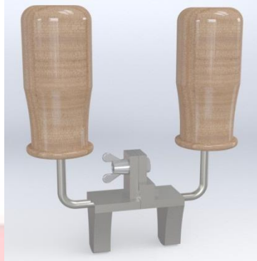
Gambar 3 Rancangan Usulan Alat Bantu Pembentukan Material

Terkadang operator mengampasnya melebihi batas garis pola sehingga terdapat material alas tumit yang bentuknya tidak simetris. Alat bantu pembentukan material yang dirancang berbahan dasar besi plat setebal 15mm dengan pegangan alat bantu berbahan dasar kayu. Rancangan usulan alat bantu ini mampu membentuk material sebanyak 20 buah sekaligus.