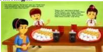
Gambar Tampak buku halaman 2

Pada halaman kedua ditampilkan konten lokal, berupa budaya makan pempek di Palembang adalah dengan menggunakan tangan, sehingga dirasa tepat untuk ditampilkan terkait aktifitas Cuci Tangan Pakai Sabun dan tampilan konten lokal.