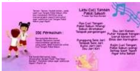
Gambar Tampak buku halaman 14

Pada halaman kedua ditampilkan konten lokal, berupa budaya makan pempek di Palembang adalah dengan menggunakan tangan, sehingga dirasa tepat untuk ditampilkan terkait aktifitas Cuci Tangan Pakai Sabun dan tampilan konten lokal.