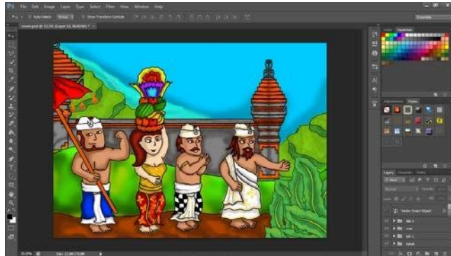
Gambar 4.8 Cover depan buku