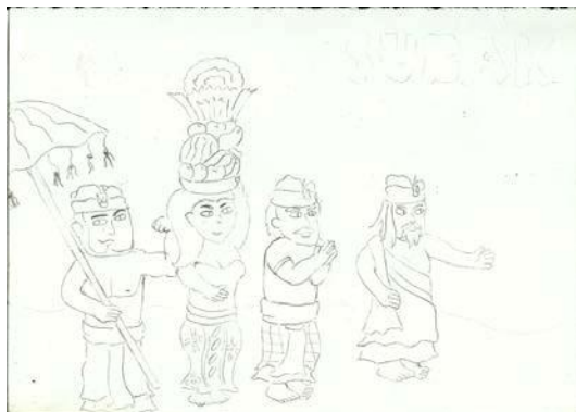
Gambar 4.4 Sketsa karakter Sumber: Hasil sketsa karya I Gusti Ngurah Wahyu Parmadi

Ilustrasi karakter dimulai dengan pembuatan sketsa lalu discan agar menjadi file digital dan bisa dilakukan pewarnaah digital. Bentuk dari karakter mengambil refrensi dari karakter ilustrasi remaja umur 12-15 Bali seperti yang sudah dijelaskan. Berikut merupakan seksta dan hasil digital pewarnaan dari perancangan karakter.