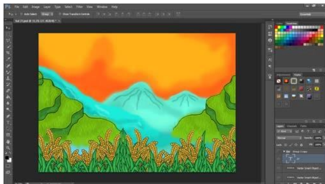
Gambar 4.10 Lanskap subak

Pada bagian isi juga menggunakan latar panorama lanskap subak berteras dengan warna langit yang berbeda-beda agar terkesan penuh warna. Layout dibuat rapi mempergunakan style juvenile dengan ukuran font headline lebih besar dari ukuran font isi.