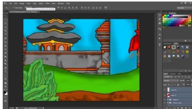
Gambar 4.9 Cover belakang buku Sumber: Hasil oleh visual karya I Gusti Ngurah Wahyu Parmadi

Pada bagian isi juga menggunakan latar panorama lanskap subak berteras dengan warna langit yang berbeda-beda agar terkesan penuh warna. Layout dibuat rapi mempergunakan style juvenile dengan ukuran font headline lebih besar dari ukuran font isi.