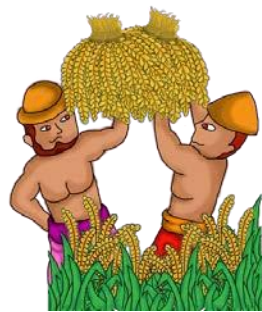
Gambar 4.7 Pewarnaan digital karakter 2 Sumber: Hasil oleh visual karya I Gusti Ngurah Wahyu Parmadi