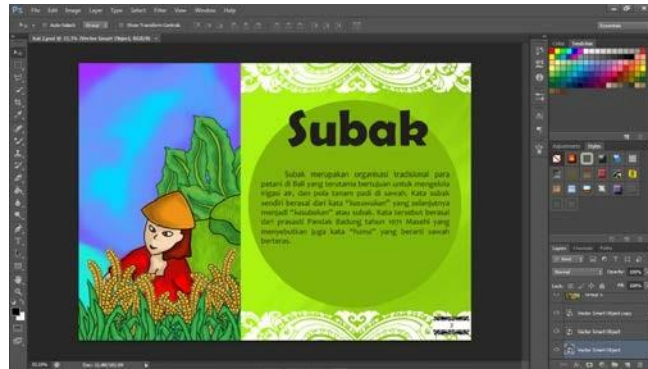
Gambar 4.11 Layout isi buku