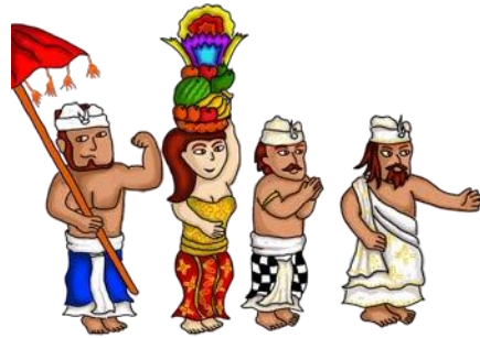
Gambar 4.5 Pewarnaan digital karakter Sumber: Hasil oleh visual karya I Gusti Ngurah Wahyu Parmadi