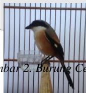
Gambar 2. Burung Cendet

Burung cendet merupakan jenis burung berkicau yang bersifat predator dan memiliki suara variasi isian yang sangat baik. Cendet termasuk burung favorit untuk para penghobi yang senang dengan burung yang bisa menirukan berbagai suara burung lain. Burung ini memiliki habitat asli di hutan, terutama di pepohonan tinggi. Burung cendet memiliki panjang tubuh kurang lebih 25 cm dengan ciri berekor panjang, berwarna hitam, coklat dan putih pada badan.