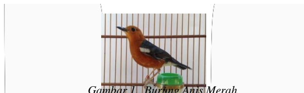
Gambar 1. Burung Anis Merah

Anis merah ( Zoothera citrina ) atau yang lebih dikenal dengan punglor merupakan burung berkicau yang populer di kalangan komunitas pecinta burung berkicau. Anis merah mampu memberi pesona dan daya pikat tinggi kepada pecinta burung karena gaya telernya yang khas. Anis merah memiliki ciri bulu berwarna merah bata pada bagian kepala hingga badan.