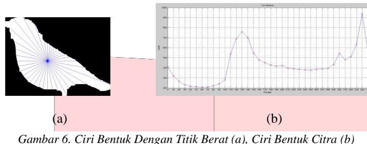
Gambar 6. Ciri Bentuk Dengan Titik Berat (a), Ciri Bentuk Citra (b)

Pada proses ekstraksi ciri bentuk, citra input yang digunakan adalah citra hasil labelling & thresholding. Langkah pertama yang dilakukan adalah pencarian titik berat dari citra input. Titik berat didapatkan dengan cara mencari pixel koordinat (y,x) pada gambar dimana pixel tersebut merupakan titik yang memberikan resultan gaya sama dengan nol dan membuat gambar burung dalam keseimbangan statik. Setelah didapat titik berat dari citra kemudian akan dihitung jarak pixel dari titik berat tersebut sampai ke batas luar citra dengan interval sudut tertentu. Jarak yang diperoleh nantinya akan digunakan sebagai ciri bentuk dari citra.