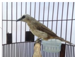
Gambar 5. Burung Trucukan

Burung trucukan ( Pycnonotus goiavier ) merupakan salah satu jenis burung berkicau yang banyak digemari dan dipelihara karena suaranya yang mengalun dengan ropelannya yang khas. Burung trucukan memiliki ukuran kurang lebih 20cm dengan badan berwarna putih dan coklat pucat. Burung jenis ini sering dijumpai sehari-hari baik di taman dan juga pepohonan rimbun di pinggir jalan.