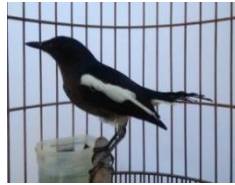
Gambar 3. Burung Kacer