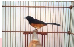
Gambar 4. Burung Murai Batu

Burung murai batu ( Copsychus malabaricus ) dikenal memiliki kemampuan berkicau yang baik dengan suara merdu yang sangat bervariasi. Burung murai batu memiliki ciri bulu berwarna hitam pada bagian punggung dan merah kecoklatan pada bagian dada serta memiliki ciri ekor yang panjang.