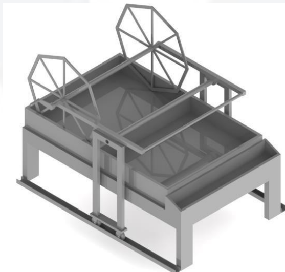
Gambar 1 Konsep Meja Terpilih

Dari hasil seleksi konsep didapatkan bahwa konsep 2 sebagai konsep terpilih dengan total nilai bobot terbesar yaitu 3.85.