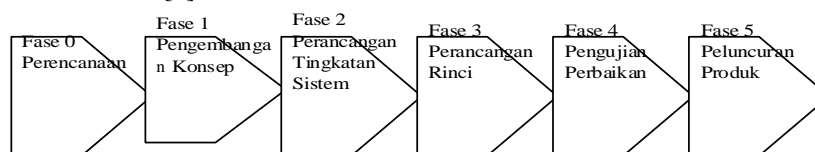
Gambar 1 Tahap Pengembangan Produk Ulrich-Eppinger

Pengembangan produk merupakan serangkaian aktivitas yang dimulai dari analisa persepsi dan peluang pasar, kemudian diakhiri dengan tahap produksi, penjualan dan pengiriman produk. Proses pengembangan produk secara keseluruhan terdiri dari 6 fase [3]