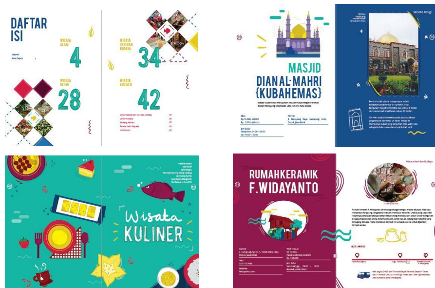
Gambar 2. Sample Layout Buku Panduan Wisata “Jelajah Depok”