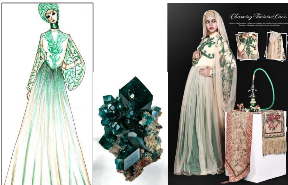
Gambar 6 Look 5

Judul : Luxury Feminine Dress Material : Wine Tafetta & Chiffon, Lightgrey Tulle & Satin combined with Aubregins Application Teknik : Bordir kerancang, cabut/ tarik serat, jahit tindas & felting