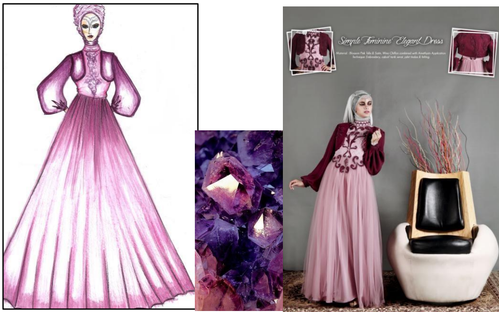
Gambar 4 Look 3 Sumber : Dokumentasi Pribadi (2015)

Judul : Feminine Romantic Dress Material : Scarlet Chiffon, Cream Satin & Tulle combined with Ruby Red Application Teknik : Embroidery, cabut/ tarik serat, jahit tindas & felting.