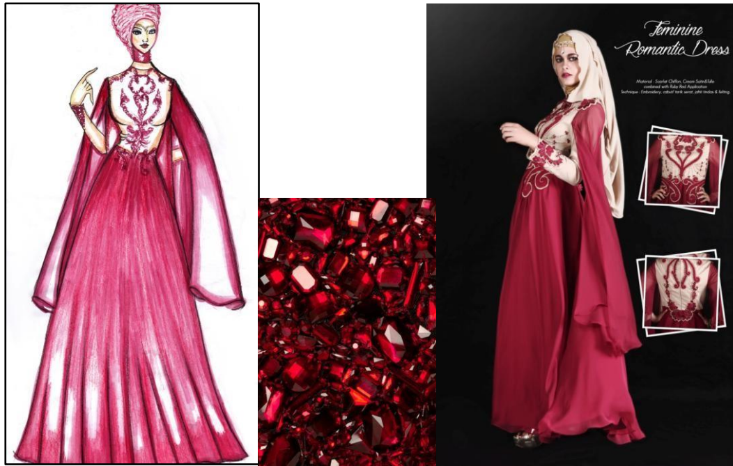
Gambar 3 Look 2 Sumber : Dokumentasi Pribadi (2015)

Judul : Feminine Romantic Dress Material : Scarlet Chiffon, Cream Satin & Tulle combined with Ruby Red Application Teknik : Embroidery, cabut/ tarik serat, jahit tindas & felting.