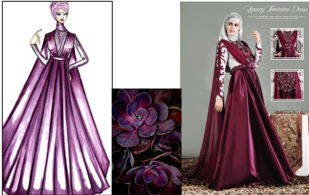
Gambar 5 Look 4

Judul : Luxury Feminine Dress Material : Wine Tafetta & Chiffon, Lightgrey Tulle & Satin combined with Aubregins Application Teknik : Bordir kerancang, cabut/ tarik serat, jahit tindas & felting