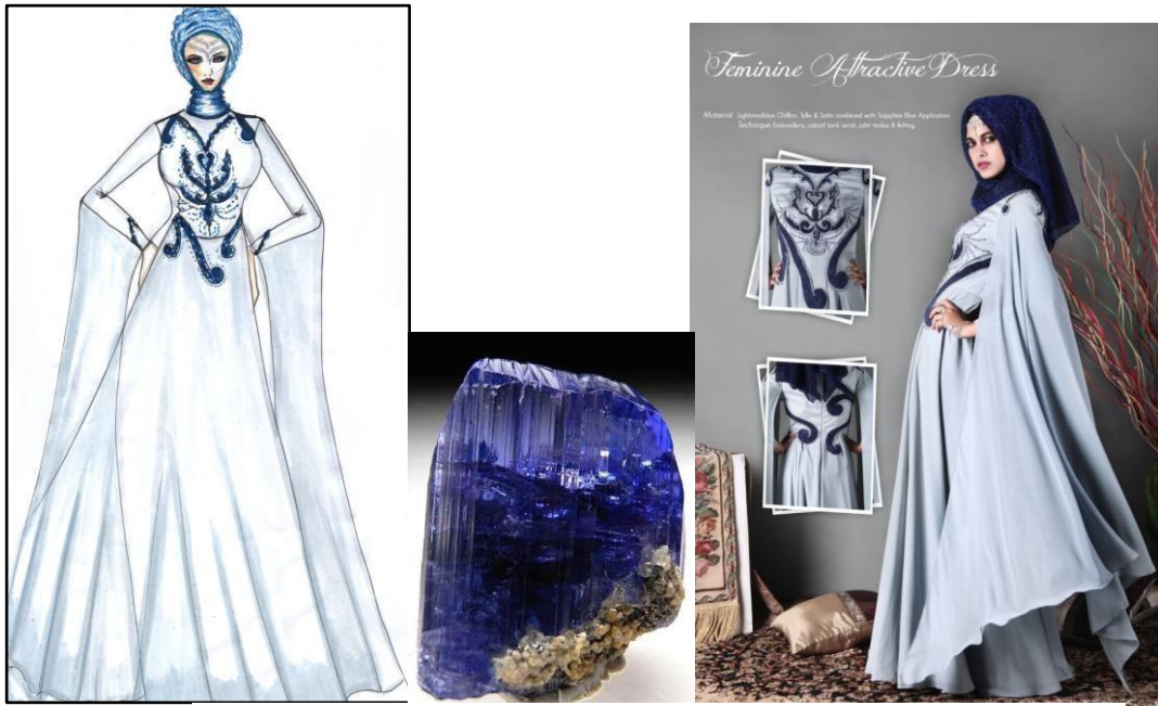
Gambar 2 Look 1

Judul : Feminine Attractive Dress Material : Lightsteelblue Chiffon, Tulle & Satin combined with Sapphire Blue Application Teknik : Embroidery, cabut/ tarik serat, jahit tindas & felting.