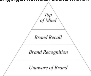
Gambar 3. Piramida Brand Awareness

Berdasarkan definisi di atas dapat disimpulkan bahwa kesadaran merek merupakan kemampuan konsumen untuk mengenali atau mengingat kembali suatu merek dari suatu kategori produk tertentu.