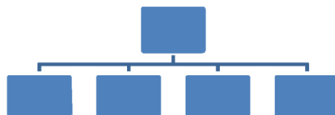
Gambar 2. Aaker's Brand Equity Framework