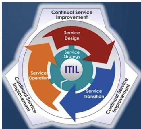
Gambar 2. Service Lifecycle ITIL versi 3

Information Technology Infrastructure Library (ITIL) [3] adalah suatu kerangka kerja umum yang menggambarkan best practice layanan manajemen teknologi informasi. ITIL menyediakan kerangka kerja bagi tatakelola teknologi informasi. Best practice memfokuskan diri pada pengukuran terus menerus dan perbaikan kualitas layanan teknologi informasi, baik dari perspektif bisnis dan pelanggan.