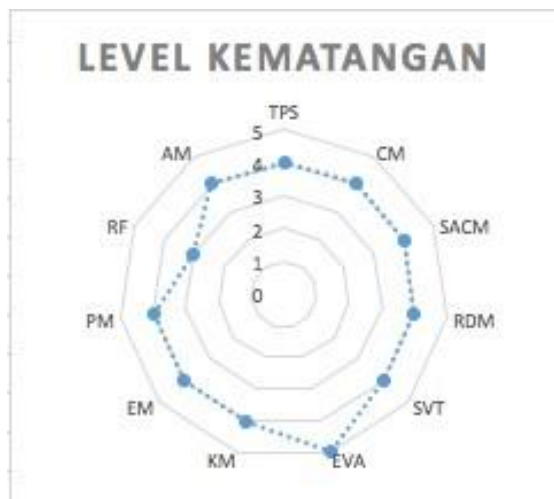
Gambar 4. Level kematangan per subdomain

Berdasarkan hasil penilaian pada Tabel 4, level kematangan per subdomain dapat ditunjukkan pada Gambar 4.