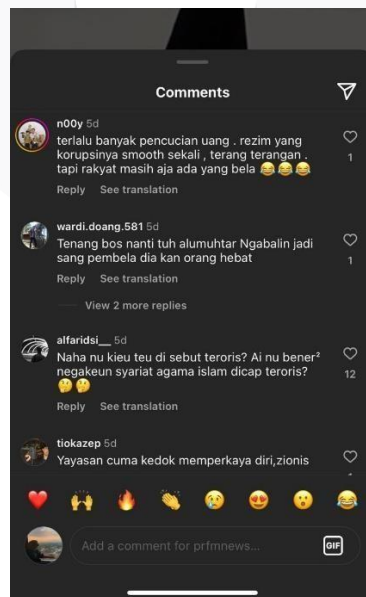
Gambar 1. Bukti Bahwa PRFM News Menggunakan Emotional Appeal

Selanjutnya, melalui emotional appeal, PRFM News menciptakan keterhubungan emosional dengan pengikutnya dengan menyoroti cerita-cerita yang menggerakkan perasaan, membangun empati, dan membuat informasi lebih relevan secara personal. Tujuannya teknik ini untuk memotivasi tindakan atau respons tertentu. Berikut contoh emotional appeal pada netizen PRFM News.